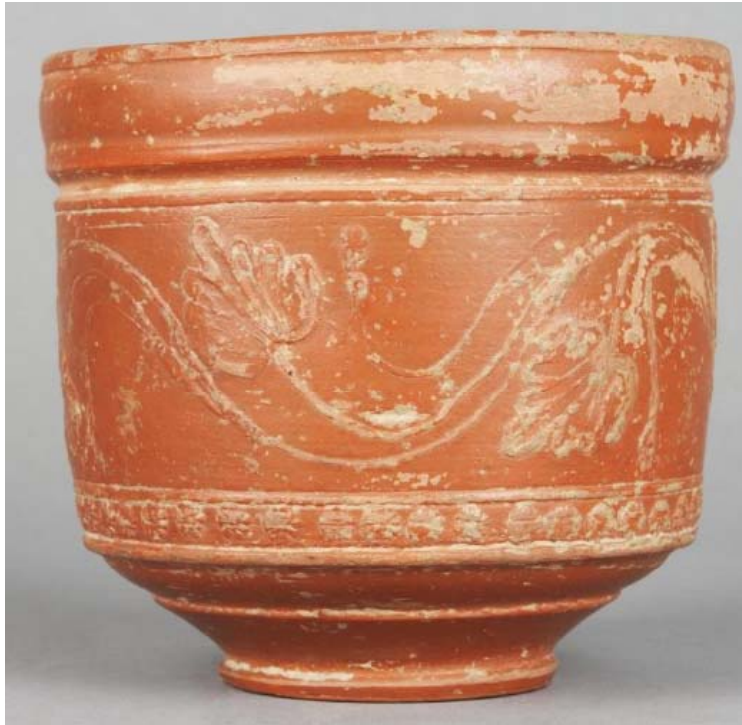
Vaso de Terra Sigillata Hispánica de la forma 30, Museo Arqueológico Nacional