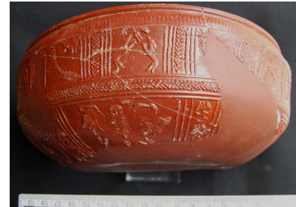
Cuenco de terra sigillata hispánica, forma 37b, hallado en Segobriga

Cocción y composición Obtenidas mediante cocción oxidante en hornos de irradiación, con pastas de color ocre, siena y rosa tostado, en ocasiones, con pequeñas vacuolas redondeadas y de pequeño tamaño. Los desgrasantes corresponden a pequeñas partículas de tonos ocre y amarillentas, de forma redondeada.