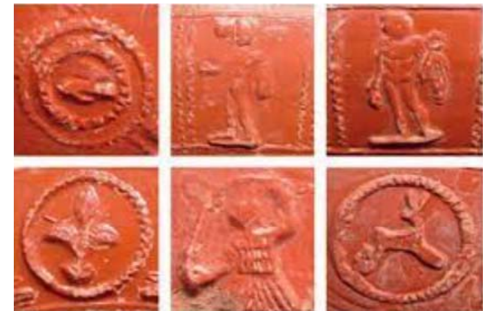
Motivos decorativos de terra sigillata hispánica procedentes de Augusta Emerita