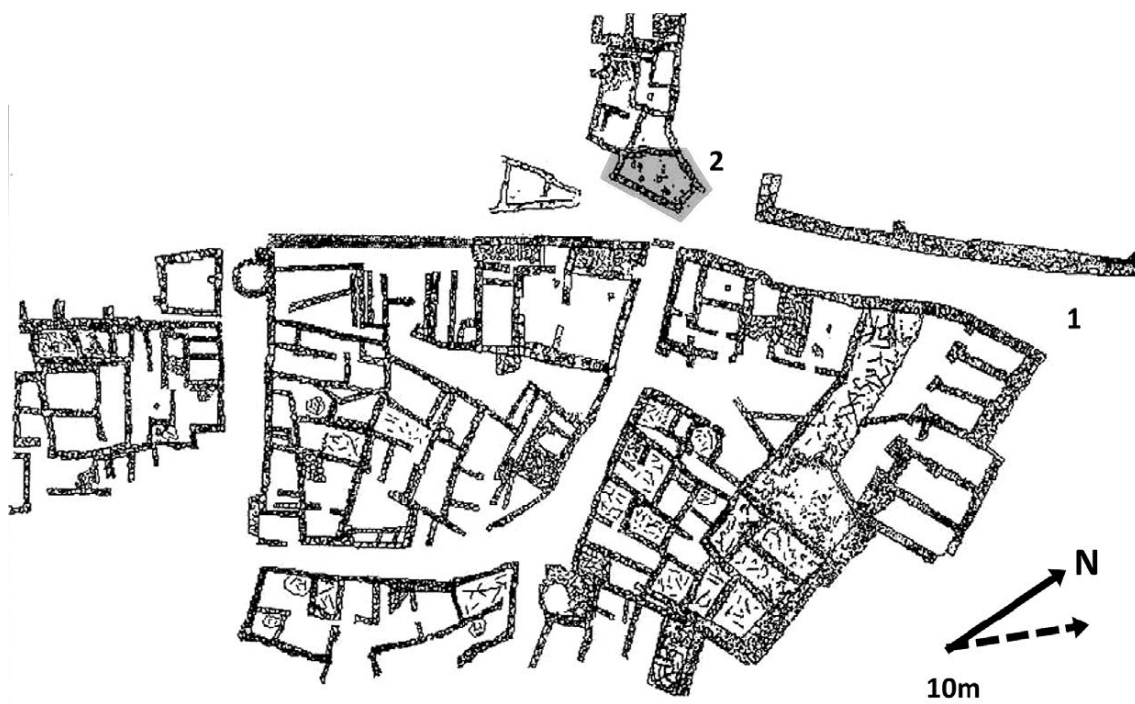
Figura 2. Planimetría del oppidum del Cerro de las Cabezas en Valdepeñas, Ciudad Real (Manzaneda, 2017: 340).

complementos. La función de su monumentalización sigue fluctuando entre un fin disuasorio o la capacidad ofensiva de las comunidades indígenas de la península; en cualquiera de los dos casos fruto de mayores amenazas (Bonet, 2009: 107-144).