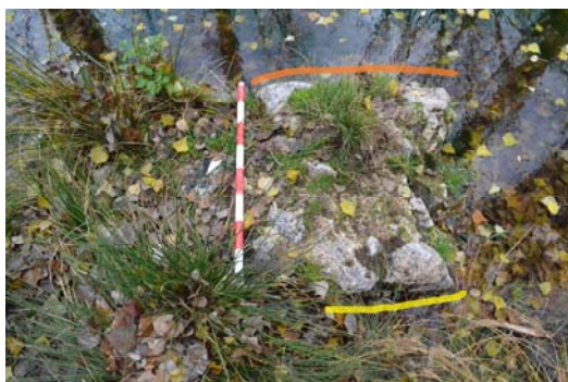
Figura 8. Detalle del Muro este junto al saliente norte donde se aprecia la cara interna, marcada por la línea amarilla, y la cara externa, en naranja, de la construcción (fotografía realizada en noviembre de 2019 por J. Angulo).

En cuanto a la parte sumergida de la construcción (Fig. 9), ya hemos mencionado que la proliferación de lodo y desechos, así como que el agua mane de forma constante de su interior, dificulta el estudio del interior de Fuente Redonda. Por este motivo gran parte de nuestro conocimiento se basa en los testimonios locales. Hasta el momento se han realizado varios intentos de drenaje y limpieza del mismo, pero sin éxito 12 . Cabe destacar el testimonio de un antiguo habitante de Uclés que estuvo en una de esas limpiezas del