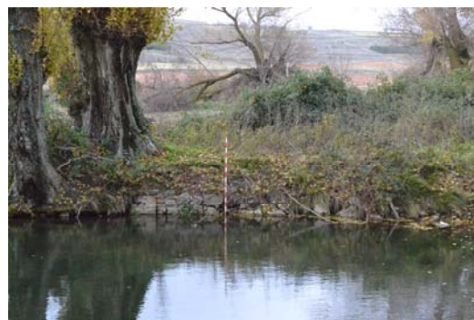
Figura 5. Muro oeste junto al saliente sur, en la que se aprecia la técnica del opus vittatum

El Muro este tiene 1,10 m de alto desde la base del escalón, mientras que desde la superficie del agua mide unos 80 cm aproximadamente (Fig. 6). En esta sección del muro solo podemos apreciar una parte del alzado, quedando el resto bajo la maleza que lo rodea (Fig. 7). Asimismo, debemos destacar la presencia de restos del muro situado junto al saliente norte (Fig. 8). Según la medición realizada en esta área, el muro tiene 80 cm de ancho, además, podemos apreciar la cara interna del muro. Gracias a este fragmento hemos podido ver que las dimensiones de las piedras que forman las hileras de muro no son iguales. Se han constatado tres tamaños: 24 x14 cm, 20 x10 cm o 33 x 35 x18 cm. 11