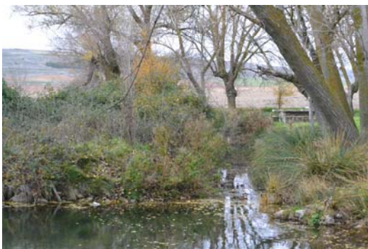
Figura 2. Imagen del Saliente sur.

Sabemos que el interior de Fuente Redonda está formado por una serie de plataformas paralelas al muro exterior que descienden hasta alcanzar el centro de la construcción, donde se sitúa una losa con una perforación central, de