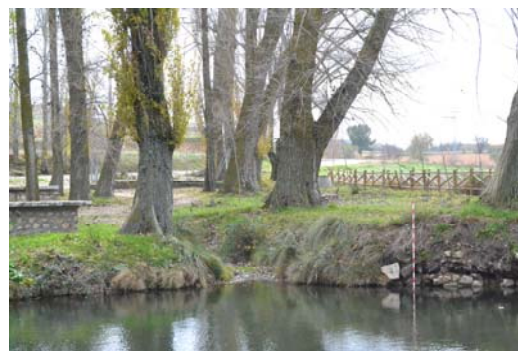
Figura 3. Fotografía del aliente norte.

donde mana el agua 7 (Abascal 2011: 252). Uno de los elementos que debemos tener en cuenta en nuestro trabajo es la proliferación de maleza, tanto en el interior como en el exterior del estanque, así como el abundante fango en el interior del mismo 8 . Esta situación da lugar a que muchas de las partes del estanque sean prácticamente imposibles de identificar. A esto debemos añadir que en la actualidad gran parte de las piedras de la cara exterior, que da a la fuente, se han perdido. Igualmente, tampoco se conoce si lo conservado hoy correspondería con su altura original.