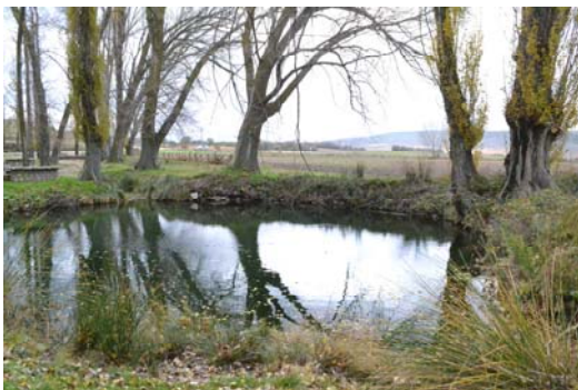
Figura 1. Imagen general de Fuente Redonda (Imagen realizada en noviembre de 2019 por J. Angulo).

donde coincide con uno de los depósitos que nutre de agua 6 a Uclés, y otro orientado al norte (Fig. 3) el cual comunica con el Bedija. Basándonos en la orientación de las dos partes del muro los hemos denominado como Muro este y Muro oeste.