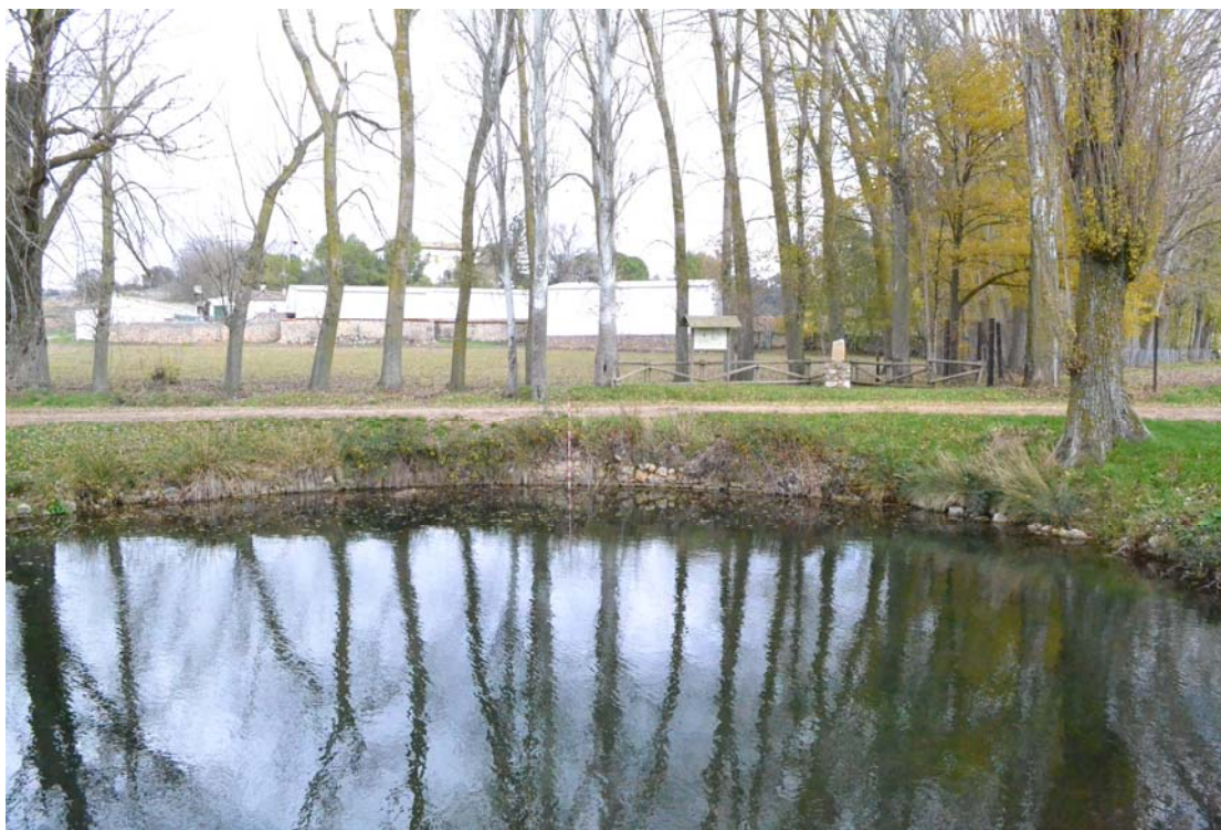
Figura 6. Muro este. En el fondo de la imagen se ve el cartel informativo sobre Fuente Redonda y una réplica de la inscripción a Deo Aironi (fotografía realizada en noviembre de 2019 por J. Angulo).