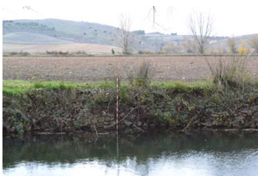
Figura 4. Parte central del Muro oeste

Sobre las dimensiones del muro encontramos una leve variación entre el sector este y el oeste. El Muro oeste (Fig. 4) presenta una altura de 1 m, partiendo del primer escalón, que se encuentra bajo el agua, de los cuales 70 cm se encuentran por encima de la superficie del agua. En esta parte del muro solo conocemos la parte externa. 10 Asimismo, es donde mejor se aprecia la pérdida de las piedras del muro. (Fig. 5).