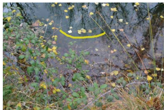
Figura 9. Imagen del interior en la que la línea marca por donde se aprecia el primer escalón (fotografía realizada en noviembre de 2019 por J. Angulo).

En cuanto a la parte sumergida de la construcción (Fig. 9), ya hemos mencionado que la proliferación de lodo y desechos, así como que el agua mane de forma constante de su interior, dificulta el estudio del interior de Fuente Redonda. Por este motivo gran parte de nuestro conocimiento se basa en los testimonios locales. Hasta el momento se han realizado varios intentos de drenaje y limpieza del mismo, pero sin éxito 12 . Cabe destacar el testimonio de un antiguo habitante de Uclés que estuvo en una de esas limpiezas del