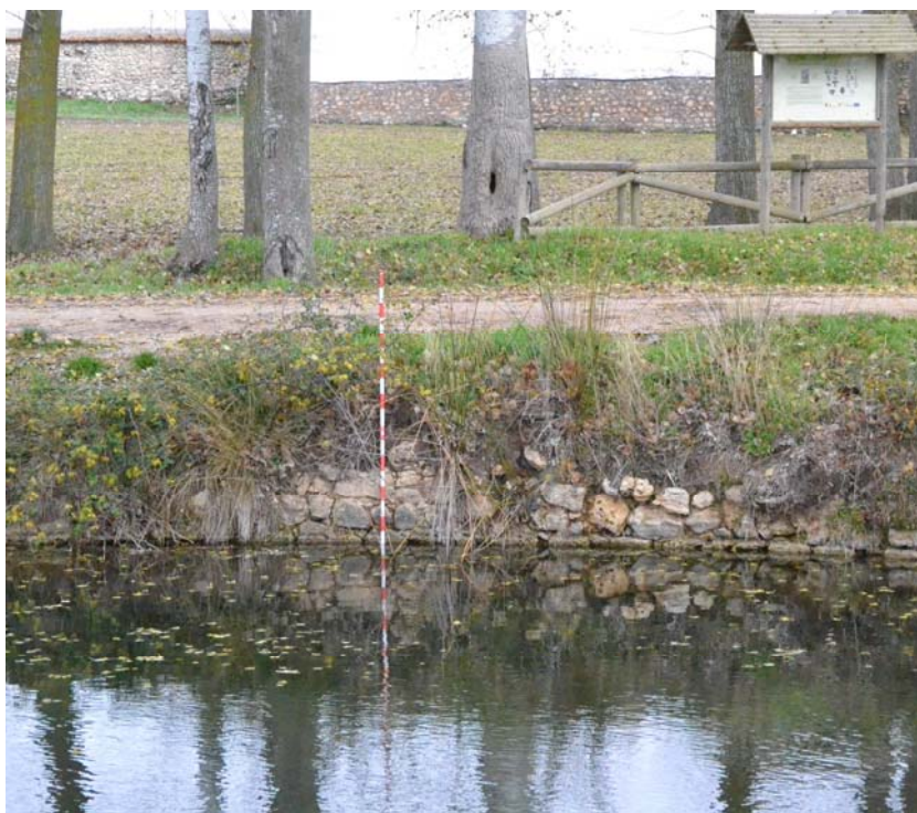
Figura 7. Detalle del Muro este en el que se aprecia la técnica del opus vittatum.