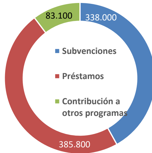
Millones de euros

Complementa al Marco Financiero Plurianual 2021-2027 con 806.900 millones de euros adicionales