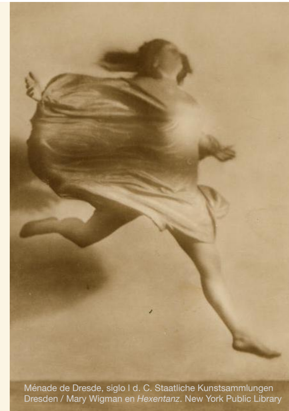
Ménéade de Dresde, siglo I d. C. Staatliche Kunstsammlungen Dresden / Mary Wigman en Hexentanz.