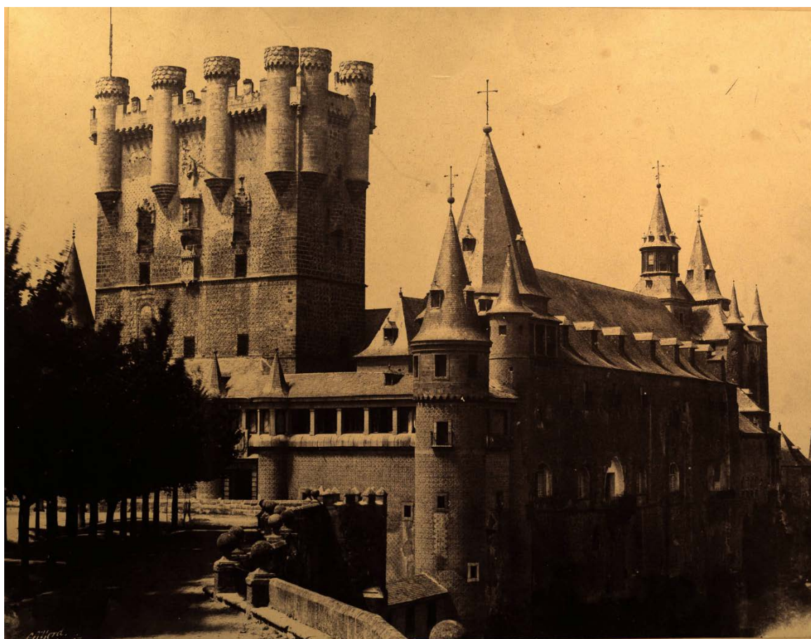
Fig. 1. Torre morisca y alcázar de Segovia. Charles Clifford. Calotipo, 1852 AGMM F.07526

ya tardío, fechado en 1852) obra del fotógrafo inglés William Edward Kilburn. Debido a que los procedimientos fotográficos avanzan con rapidez, pronto se empiezan a usar otras técnicas como el calotipo, de cuya muestra posee el AGMM, de la misma fecha que el daguerrotipo del Museo, una bella fotografía de Charles Clifford (1819-1863) titulada "Torre morisca y Alcázar de Segovia" 6 , realizada antes del incendio que sufrió el alcázar en 1862, motivo por el que se convierte en una pieza con un gran valor, no solo estético, sino también histórico, documental y científico, pues es uno de los escasos calotipos que quedan en las colecciones fotográficas en general.