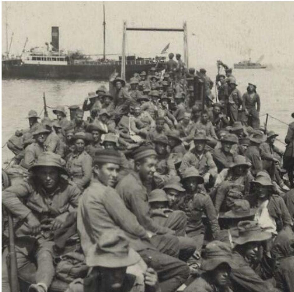
Fig.2. Desembarco de Alhucemas. Anónimo. Gelatina sobre papel baritado, 1925. F.13349

La procedencia de las fotografías que componen esta sección de Iconografía, como hemos dicho anteriormente, en muchos casos es muy difícil de precisar. Por una parte, abundan las procedentes del Cuerpo de Estado Mayor del Ejército, como las dedicadas a la Primera Guerra Mundial, Gran Guerra o "Guerra Europea", como reza en los álbumes de las más de 5.300 piezas organizadas por dicho Cuerpo y las más antiguas del Depósito de la Guerra, otras fotografías surgen de los memoriales y bibliotecas de Artillería e Ingenieros; algunas provienen de las recogidas por las ponencias de historia del antiguo Servicio Histórico Militar y por último, las menos, se deben a desinteresadas donaciones de colecciones particulares.