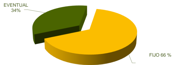
PAS LABORAL DE LA UCM POR TIPO DE CONTRATO