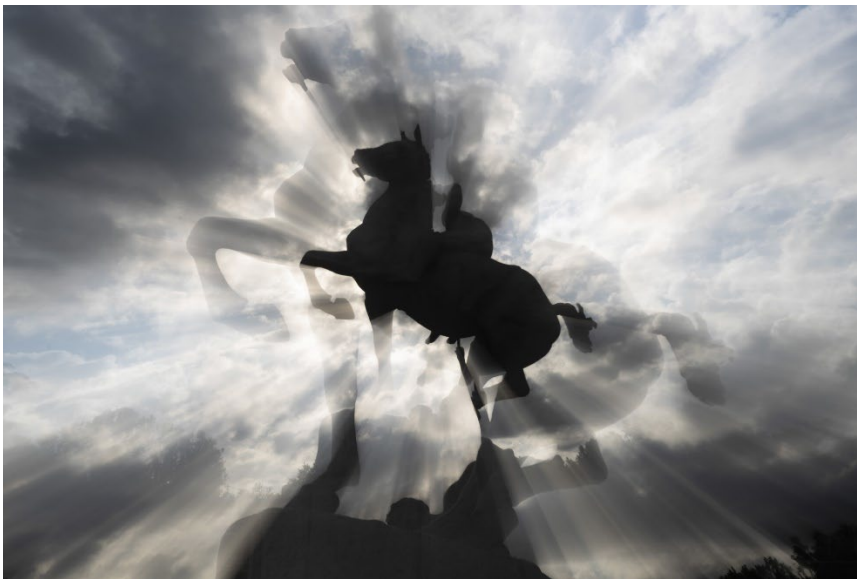
Autora SUSANA VIÑEZ RUBIO

Gabinete de Comunicación Avenida de Séneca, 2. 28040 Madrid Teléfono: 91 394 36 06/+34 609 631 142 gprensa@ucm.es www.ucm.es