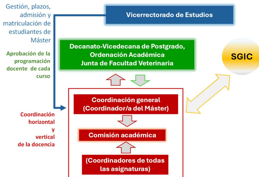
FIGURA 2.1. ORGANIZACIÓN Y MECANISMOS DE COORDINACIÓN DEL MÁSTER