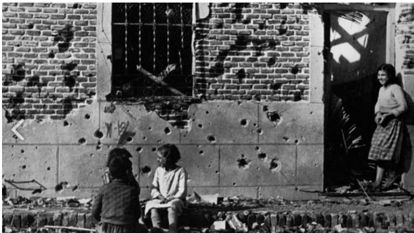
El número 10 de la madrileña calle de Peironcely, en el distrito de Puente de Vallecas, noviembre de 1936