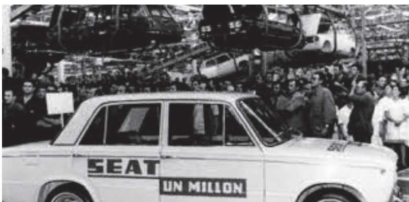
SEAT alcanza la cifra de un millón de coches fabricados, 1969