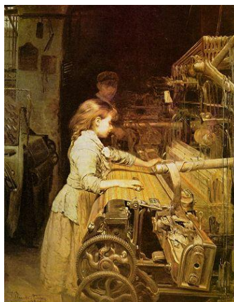
“La Tejedora”, por Joan Planella y Rodríguez (1882).