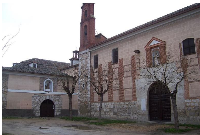
Imagen del convento y de santa Teresa de Jesús