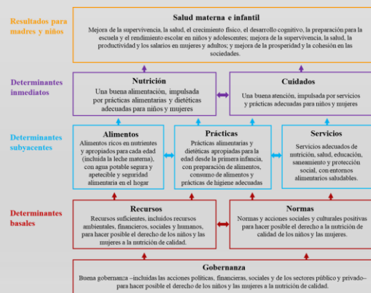
Figura 1. Marco Conceptual de los determinantes de la salud materno-infantil.

Para llevar a cabo una lucha y una prevención adecuada de la enfermedad es necesario conocer los factores de riesgo asociados con la enfermedad, para así, poder complementar y fortalecer las intervenciones nutricionales. En esta línea, UNICEF (2021), propone el siguiente marco conceptual de los determinantes de la nutrición materna e infantil (Figura 1), donde se enmarcan factores nutricionales, sociales, económicos, asistenciales, políticos etc.