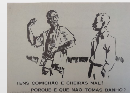
Fig. 6: “Tens comichão e cheiras mal”.