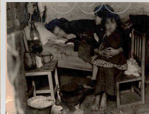
Fig. 5: A tuberculose.

A LPPS lutou também pela luta extinção do transporte de cargas feito por seres humanos, com destaque para o drama humano protagonizado na íngreme Calçada da Corticeira pelas Carquejeiras, trabalho que empregava maioritariamente mulheres, muitas vezes grávidas, e crianças, entre tantas outras iniciativas. (Fig. 4).