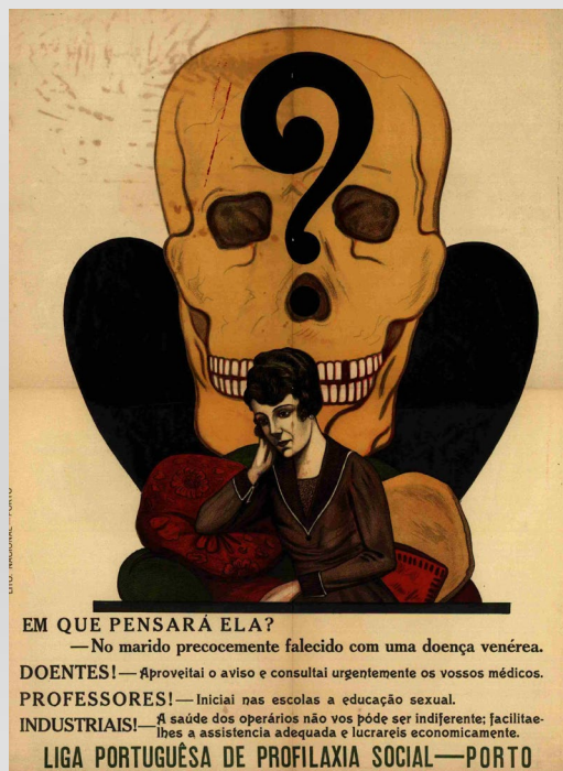
Fig. 3: “Em que pensará ela?”. Arquivo Distrital do Porto

Ainda, campanhas de prevenção e educação para as doenças venéreas, de que é exemplo o cartaz “Em que pensará ela”, de grande tiragem e divulgação por câmaras municipais, escolas e associações operárias (Figura 3); cartazes sobre os benefícios para a saúde da adoção de práticas de higiene individual, como tomar banho regularmente, lavar as mãos, a roupa, limpar a casa, abrir as janelas e deixar entrar luz natural nas habitações; assim como o combate às moscas enquanto veículo de doenças (Fig. 1, 6, 7).