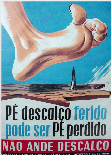
Fig. 2: “Pé descalço ferido pode ser pé perdido”.

Ao longo da primeira metade do séc. XX, a instituição interveio não apenas sobre os problemas de saúde pública mais prementes na cidade do Porto, como a sífilis, a tuberculose, o cancro ou a lepra, como também se destacou no combate a problemas sociais relevantes como a pobreza, a mendicidade, o abandono infantil, a saúde mental, os direitos laborais, entre outras áreas de intervenção.