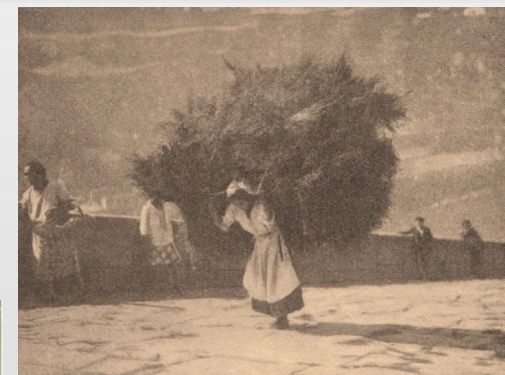
Fig. 4: As carquejeiras.

A LPPS lutou também pela luta extinção do transporte de cargas feito por seres humanos, com destaque para o drama humano protagonizado na íngreme Calçada da Corticeira pelas Carquejeiras, trabalho que empregava maioritariamente mulheres, muitas vezes grávidas, e crianças, entre tantas outras iniciativas. (Fig. 4).