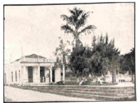
Edificio del Ayuntamiento y el edificio que fue casa de la familia de los señores de Cidra, desde un edificio de la calle de los Heranos.