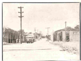
Parque de la casa municipal en la Calle de los Heranos, Cidra, desde para la construcion de viviendas y Plaza de Armas.