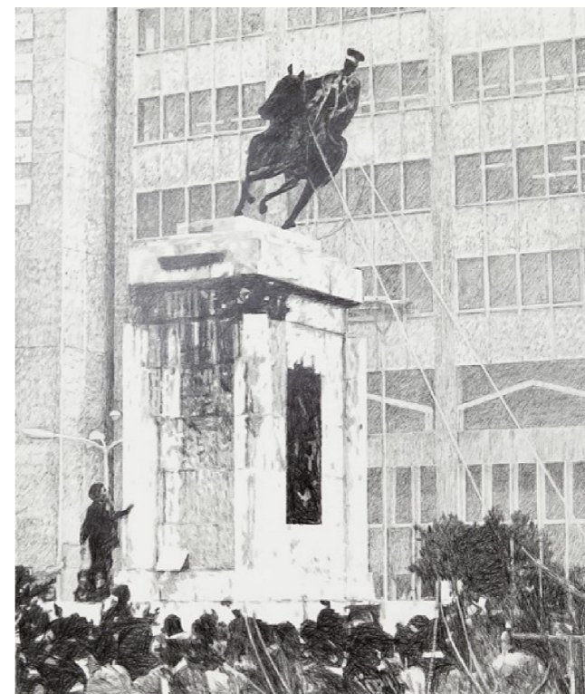
Figura 1. Sam Durant, Tehran, 1979 , 2018. Dibujo en colaboración con Milenko Prvački. Fotografía de Makenzie Goodman. Fuente: https://www.samdurant.net/work/iconoclasm/ (consultado el 22 de agosto de 2023).

se ubicaba en un ámbito distinto al del trabajo y las actividades ligadas a los sectores productivos, ahora el contexto es el del movimiento de la economía a la cultura y de la cultura a la economía. La cultura se reconfigura como veta de creación de beneficio, como recurso 8 , y la economía asume las funciones que antes eran propias de la cultura: producción de identidad, de reconocimiento, de subjetividad, de comunidad y de diferencia 9 . Este proceso de mercantilización generalizada está impulsado por la potencia de lo visual en nuestras sociedades, de modo que la economía-cultura se encuentra asociada a la imagen técnica y las nuevas formas de producción, distribución y consumo digital que llevan a cabo a una remodelación de los imaginarios articulada con la espectacularización masiva de la mercancía. Este es el momento en el que surgen los Estudios visuales, o, si se quiere, tal es el fondo de contraste sobre el que buscan dibujar su perfil.