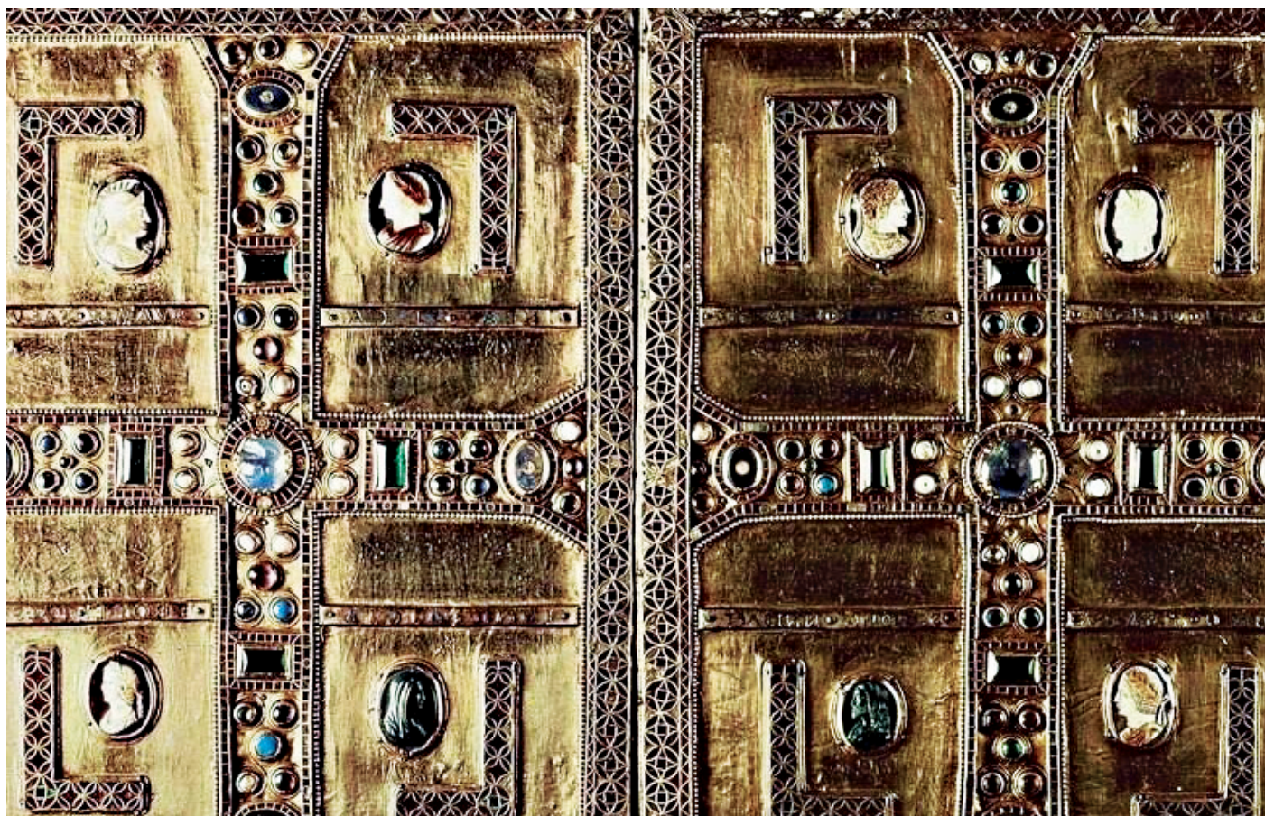
Encuadernación de los evangelios de Teodolinda.

Los materiales para escribir eran costosos y por ello, primero los papiros y luego los pergaminos, se aprovechaban al máximo. La escritura estaba apretada siendo difícil distinguir y separar palabras y párrafos. En la composición de libros se aprovechaban los folios por el anverso (recto) y el reverso (verso), pero también en hojas sueltas era habitual encontrar este interés por sacar el máximo rendimiento de un material valioso. Así, en el Codex Sangallensis 1092, de la biblioteca del monasterio de Saint Gallen (hoy en Suiza), en el recto se trazó en la primera mitad del siglo IX la planta utópica de un monasterio que se considera realizada en un scriptorium de Reichenau y dedicada al abad Gozberto. Tiempo después, seguramente cuando ya había desaparecido su utilidad, se dobló este plano en forma de libro y se reaprovechó