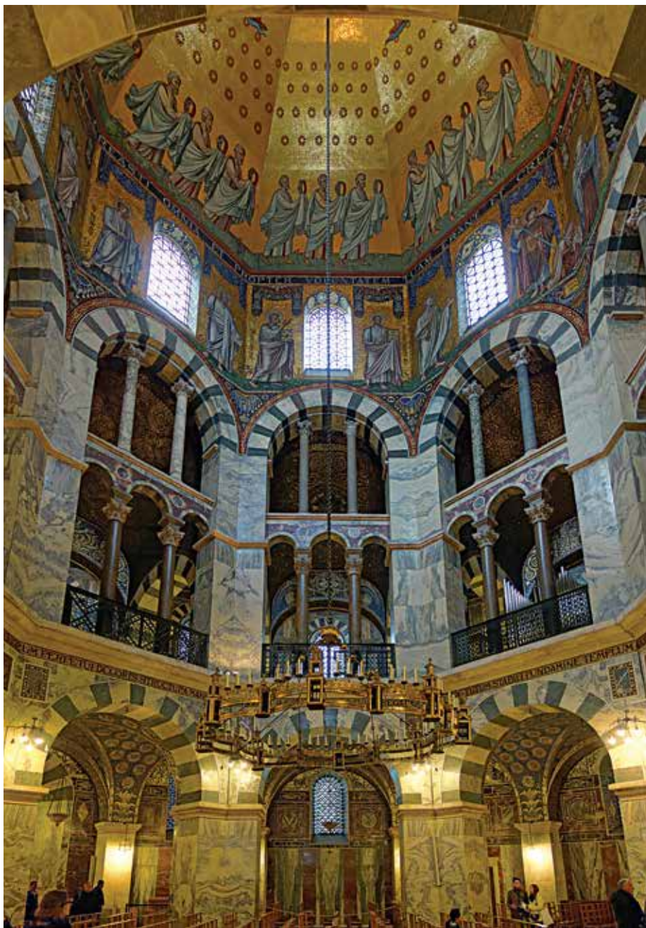
Capilla palatina de Carlomagno, Aquisgrán.