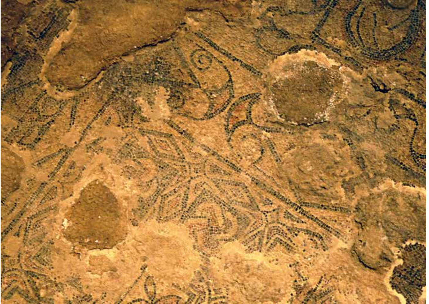
Restos de la basílica de San Vicente Mártir (Córdoba).

NUESTRA BASURA ACTUAL ESTÁ LLENA DE OBJETOS QUE EN EL PASADO HUBIERAN TENIDO UN SEGUNDO USO, SIRVIENDO MUCHOS DE ELLOS COMO MATERIALES PARA COMPONER NUEVAS OBRAS DE ARTE. EL ARTE MEDIEVAL OFRECE NUMEROSOS EJEMPLOS DE CONCEPTOS DE RABIOSA ACTUALIDAD, COMO LA ECONOMÍA CIRCULAR, LA SOSTENIBILIDAD, LA DISMINUCIÓN DE LA HUELLA ENERGÉTICA, O LAS TRES R DE REDUCCIÓN, REUTILIZACIÓN Y RECICLAJE.