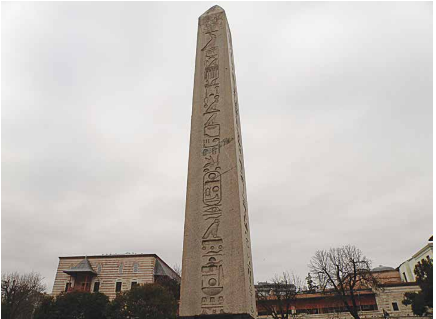
Obelisco egipcio mandado erigir por Tutmosis III que el emperador Teodosio hizo llevar hasta el hipódromo de Constantinopla.

Dejando a un lado los materiales arquitectónicos, haremos ahora un sucinto repaso a otros materiales, particularmente a los metales, marfiles y textiles. Los metales han sido tradicionalmente parte clave en la economía circular, tanto por su elevado valor económico, como por la relativa sencillez para fundirlos y hacer con ellos objetos nuevos. Así, con frecuencia, objetos suntuarios de oro y plata, fueron fundidos para acuñar moneda. Por otra parte, las herramientas de hierro, bronce o cobre- ya fuesen agrícolas, o de cocina, o cosméticas, o de costura, o médicas- cuando estaban dañadas por el uso o deterioradas, se fundían para hacer otras nuevas; lo que explica que apenas se hayan conservado colecciones de este tipo. En alguna ocasión, los objetos metálicos se colocaron en nuevos emplazamientos, reutilizándo-