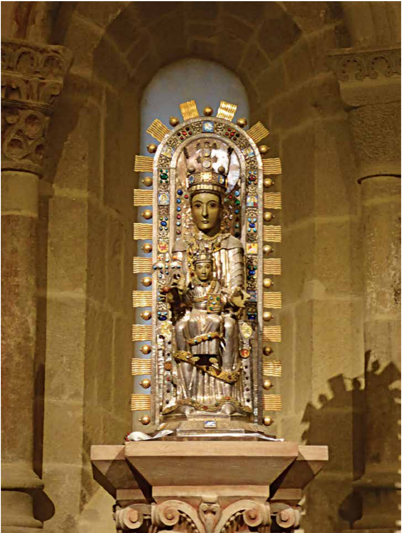
Virgen de Ujué, talla del s.XII con sellos de peregrino añadidos en el s.XIV.