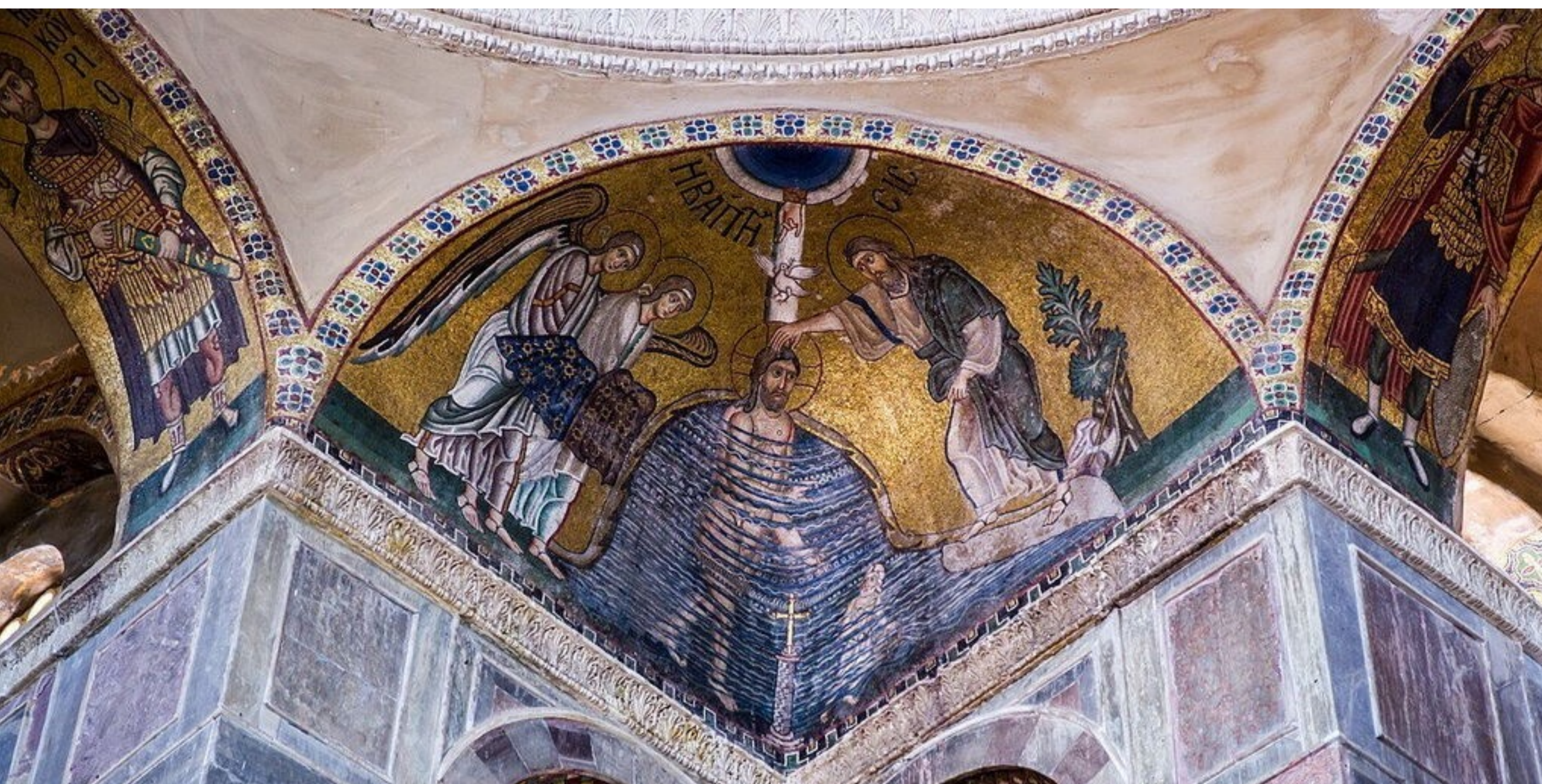
Mosaico de la pechina suroeste del Katholikon de Hosios Loukas, Siglo XI, Beocia (Grecia).

Los textos medievales se refieren al agua bautismal como “un baño de regeneración” que borra las manchas del pecado y concede una nueva vida en Cristo. No solo se ve representado en la teología, sino que también está presente en la liturgia de la iglesia, donde el agua bendita se utiliza como recordatorio constante de la purificación asociada con el bautismo.