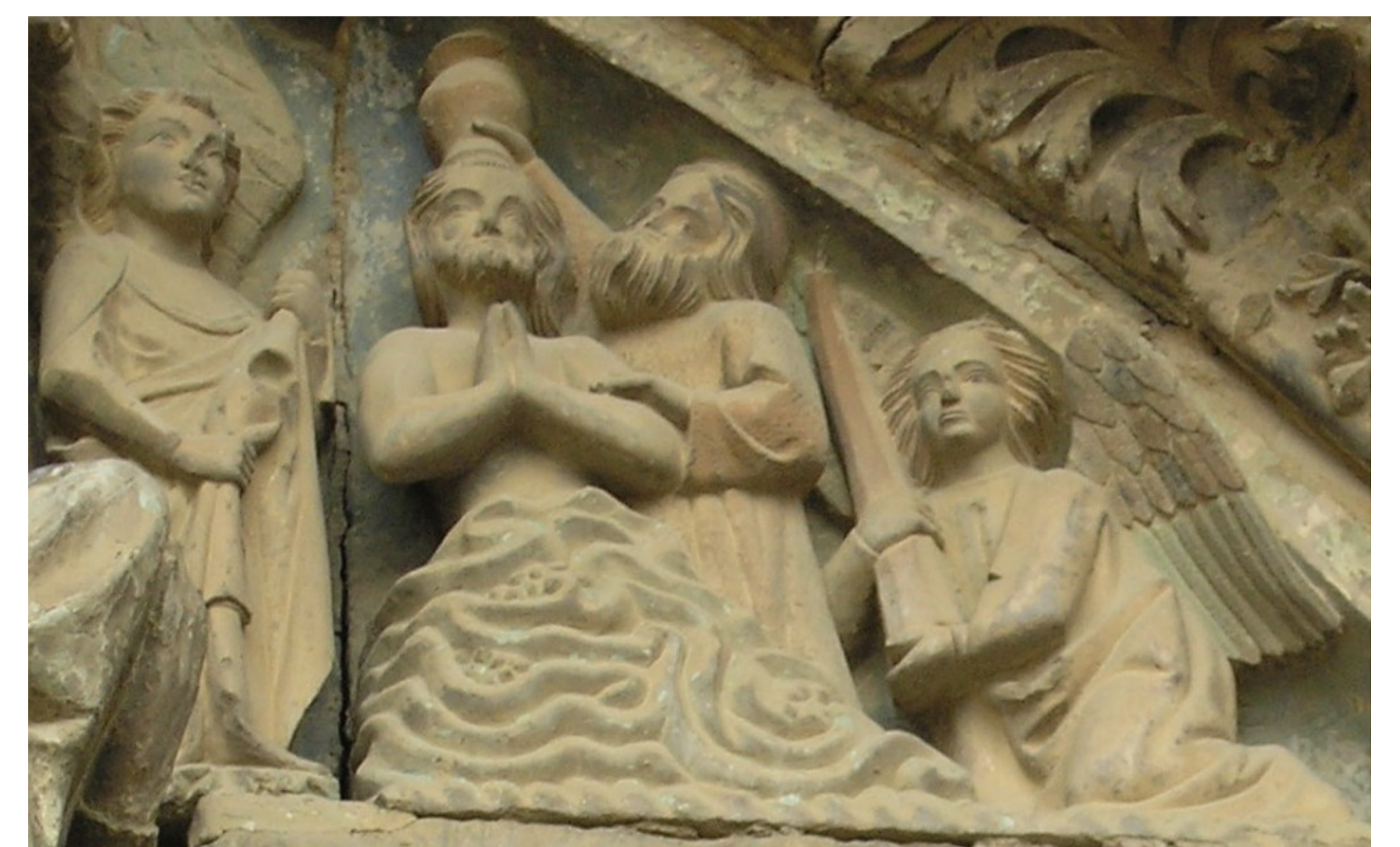
Detalle del tímpano de la portada de Santa María la Real de Olite (Navarra, España), c. 1300.

Un ejemplo relevante es la vida de san Agustín. En sus Confesiones se presenta siendo bautizado por San Ambrosio de Milán y relata esto como un momento culminante en su vida, donde llega a la purificación espiritual, mediante el abandono de su antigua vida y abrazando su nueva identidad como cristiano.