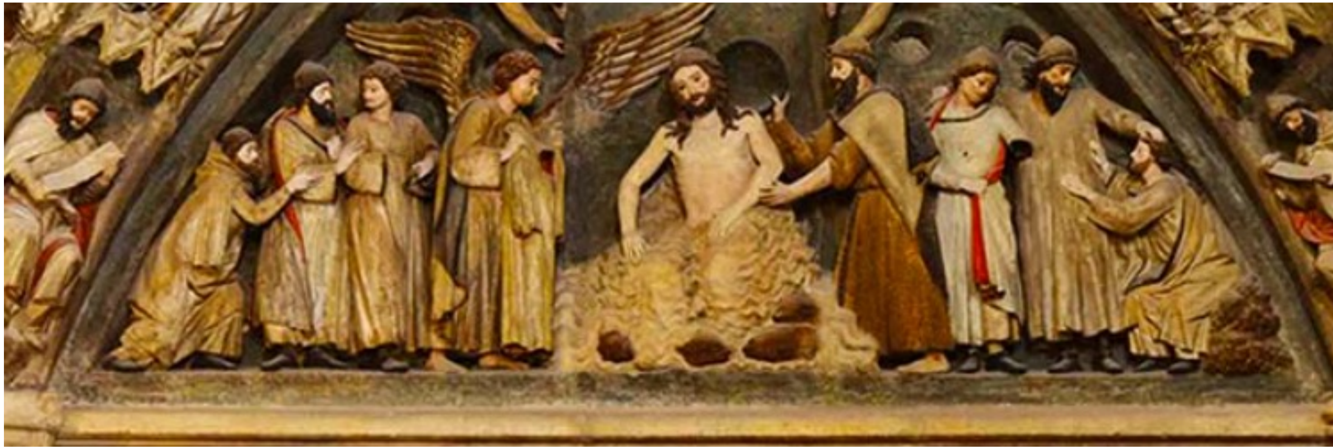
Portada del claustro alto de la Catedral de Burgos, Siglo XIII, Burgos (España).

La elección del agua como elemento central de la escena es de gran relevancia simbólica. En el contexto del bautismo se convierte en un medio de purificación espiritual, un símbolo de renovación y redención.