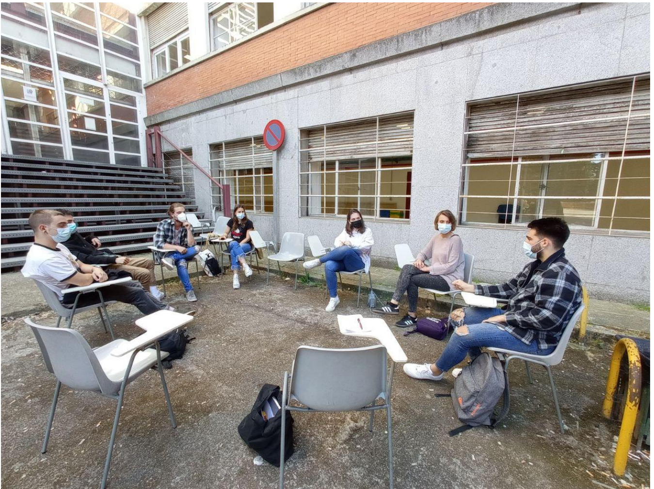
Reunión de análisis del grupo de entrevistadores en la Facultad de Derecho, 5 de mayo de 2021

El taller está compuesto por un grupo multidisciplinar de estudiantes de Criminología, Doble Grado de Derecho y Ciencia Política, Derecho, y Psicología, así como por profesoras y profesores, también de distintas disciplinas (Sociología, Derecho), con experiencia en el ámbito penitenciario. Los integrantes del proyecto diseñan y ponen en marcha un programa de actividades destinado a que los estudiantes se introduzcan en la realidad penal y penitenciaria a través de técnicas de investigación social, y en particular de la realización de entrevistas.