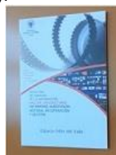
"In memoriam" (2019)