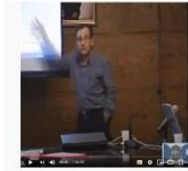
Campus Virtual UCM: integración de contenidos multimedia en el CV UCM