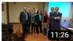
Trayectoria académica (2016)