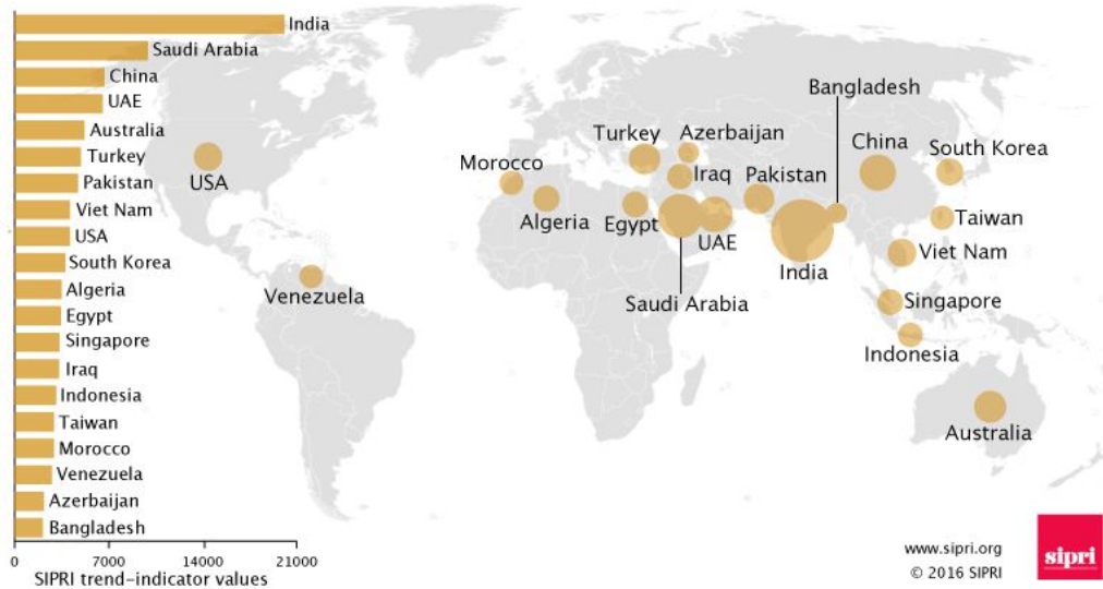
The 20 largest arms importers 2011–15

Esta débil consistencia y escasa iniciativa en una posición propia muestra la falta de arraigo de las acciones exteriores, aisladas de una estrategia regional total, guiadas en gran medida por un conjunto de consideraciones pragmáticas 35 .