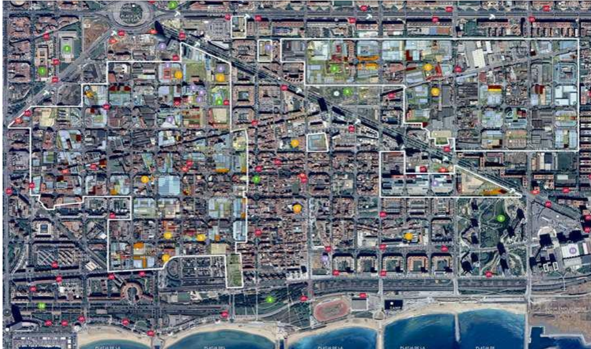
Figura 2. Fotografía aérea por satélite de los límites territoriales reconocidos a Poblenou (en blanco el trazado del proyecto 22@).

zonas del 22@ con el del distrito de Sant Martí se verá que el proyecto no establece límites territoriales tradicionales ni de barrio ni de distrito, existiendo importantes diferencias entre los tipos de imaginación geográfica en uno y otro caso, y entre éstas y los espacios de experiencia cotidiana en Poblenou, disputas que se acentuarían tras el inicio de las obras de la Rambla de Poblenou y la configuración de Fem Rambla 8 .