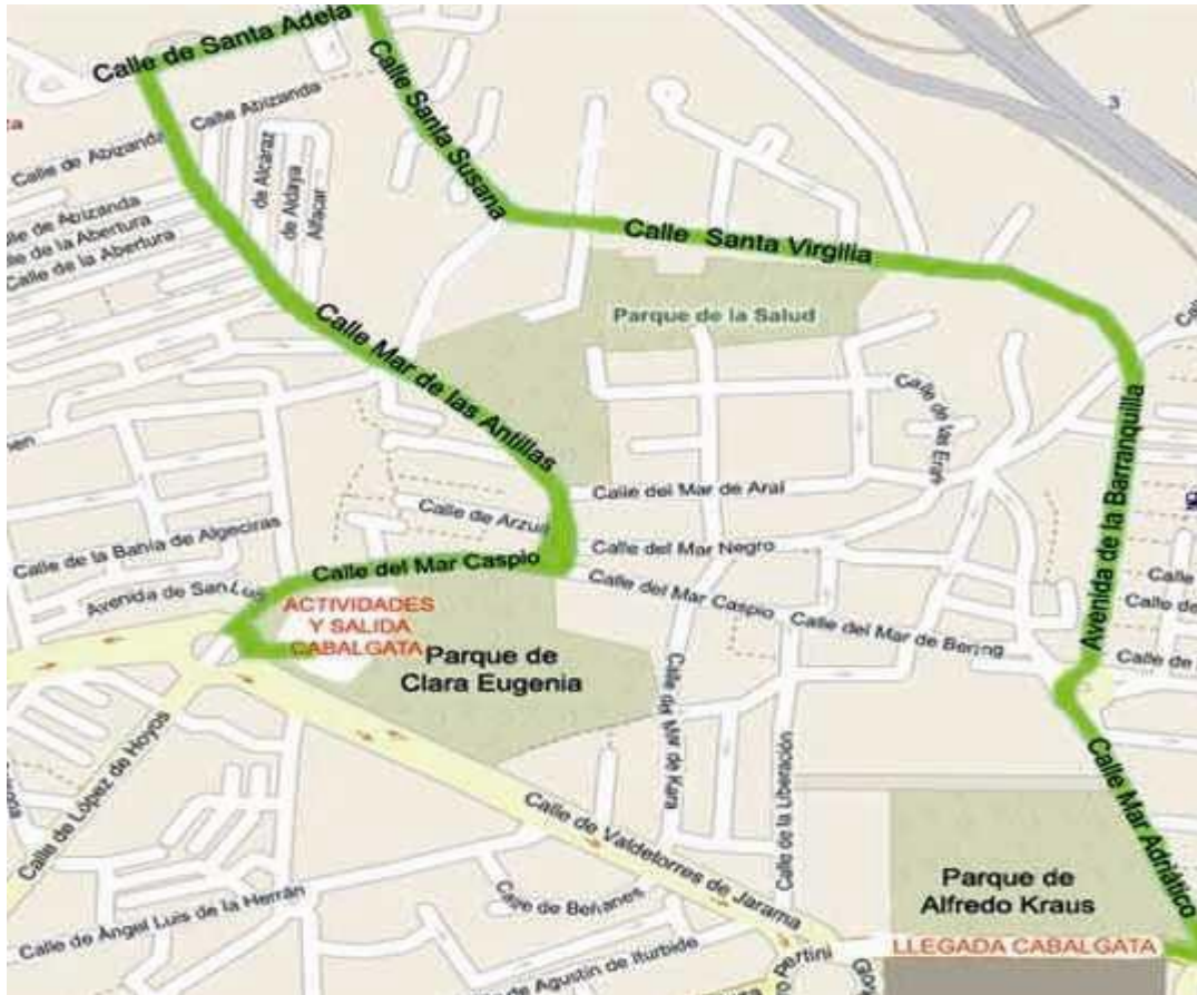
Figura 4. Plano del itinerario de la cabalgata.