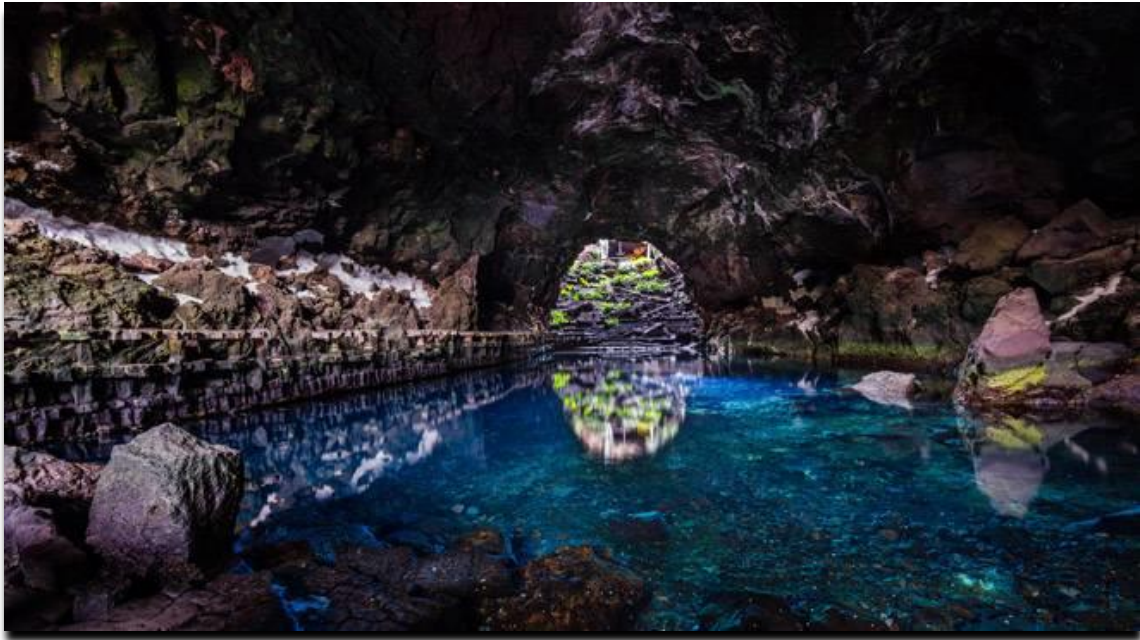
Jameos del Agua

Disfrutar de una cena alrededor de la piscina de agua color turquesa y el interminable túnel de agua donde habitan los cangrejos ciegos ( Munidopsis Polimorpha ), una especie única en todo el planeta, le proporcionará una experiencia personal difícil de olvidar.