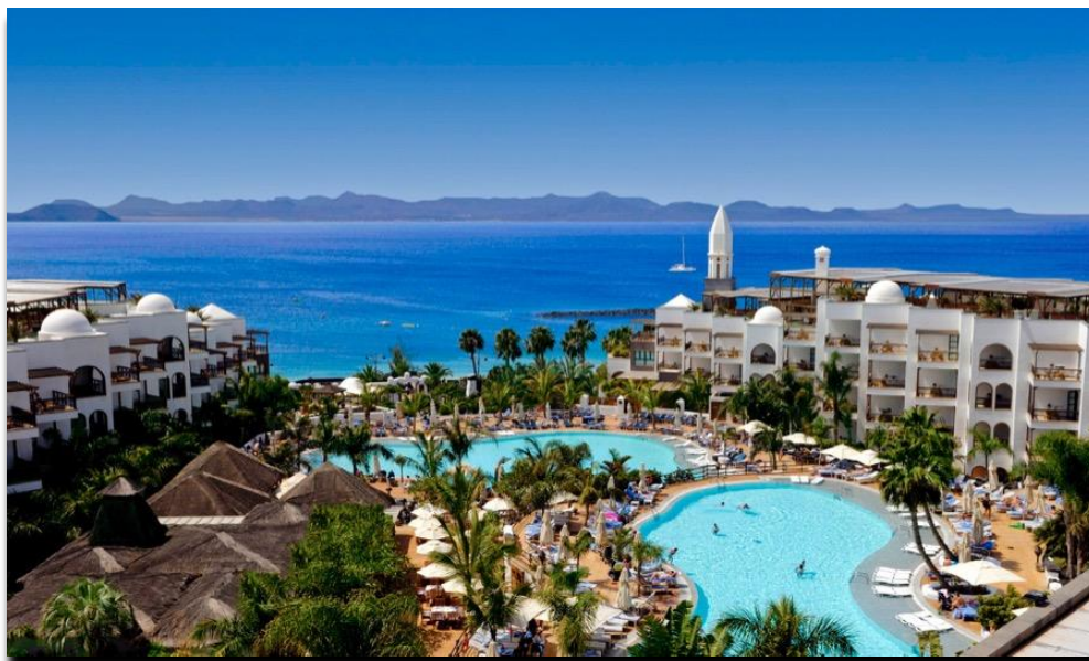
Princesa Yaiza Suite Hotel Resort