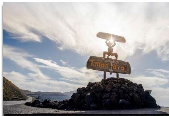
Parque Nacional de Timanfaya

El Parque Nacional de Timanfaya es otro de los grandes atractivos de Lanzarote, y se compone de 50Km 2 con más de 25 volcanes, algunos activos, destacando el Monumento Natural de las Montañas del Fuego en su interior.