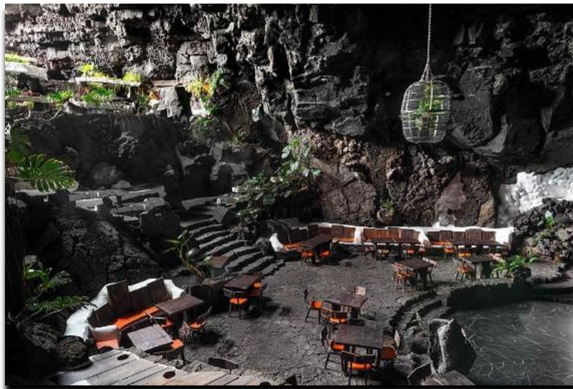
Jameos del Agua

Los asistentes analizarán y experimentarán un estudio de caso real que se podrá utilizar con fines didácticos cuando regresen a sus instituciones de origen. Un Estudio de Caso de Éxito escrito se le entregará a cada participante.