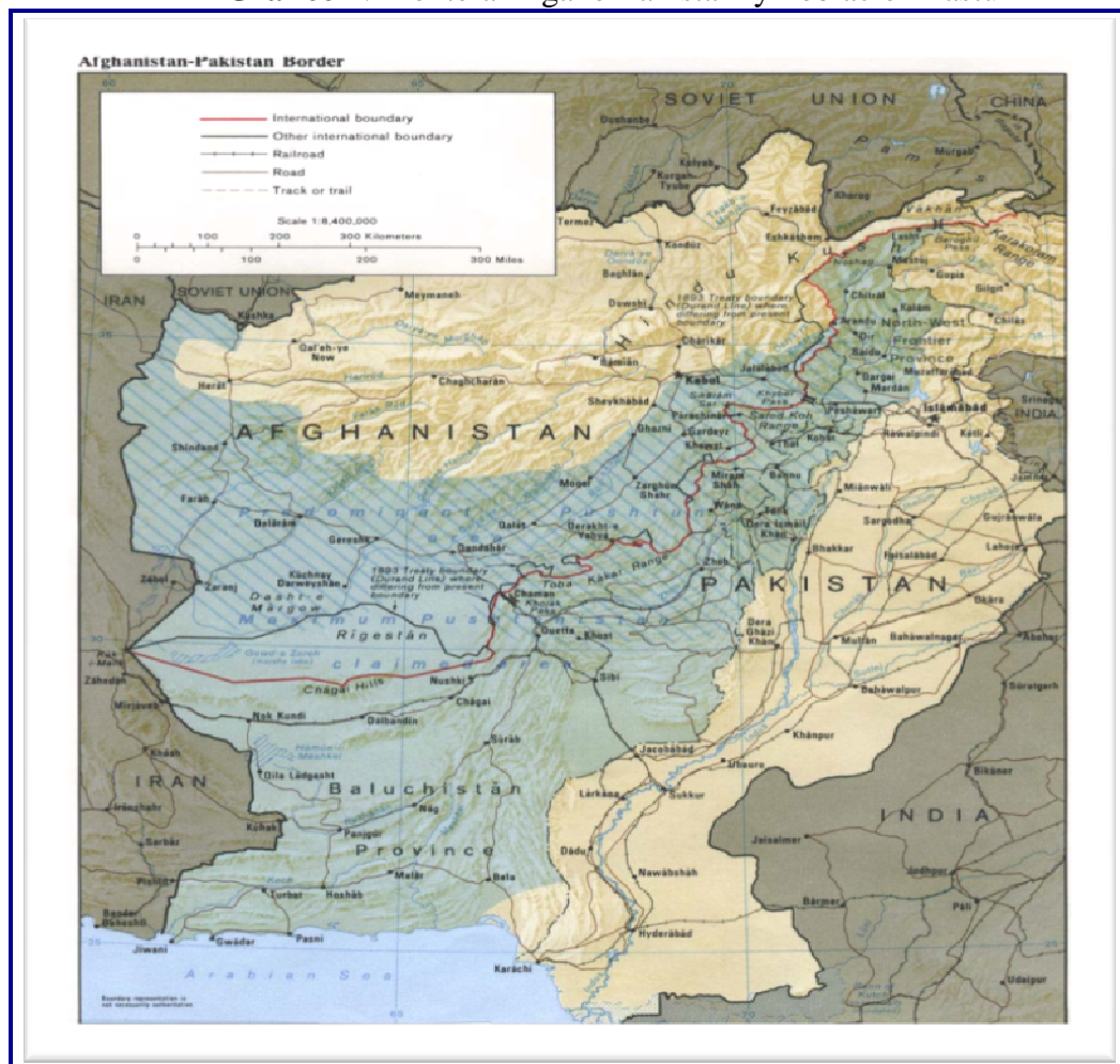
Gráfico 1: Frontera Afgano-Pakistaní y Población Pastún