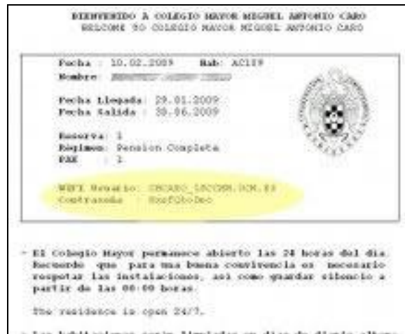
Ilustración 1. Welcome Card

Primeramente, es necesario disponer de las credenciales de conexión a la red inalámbrica. Estas credenciales se incluyen en la Welcome Card que se entrega en la administración o conserjerías de los Colegios Mayores. En la ilustración 1 se muestra una Welcome Card en la que se remarca en amarillo la ubicación de las credenciales ( WIFI Usuario y Contraseña ).