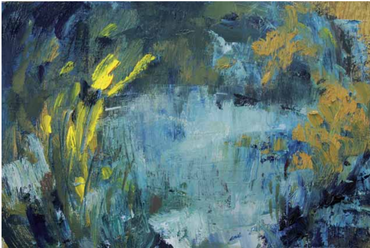
El río (Abstracción III) 20 x 30 cm Óleo sobre tabla