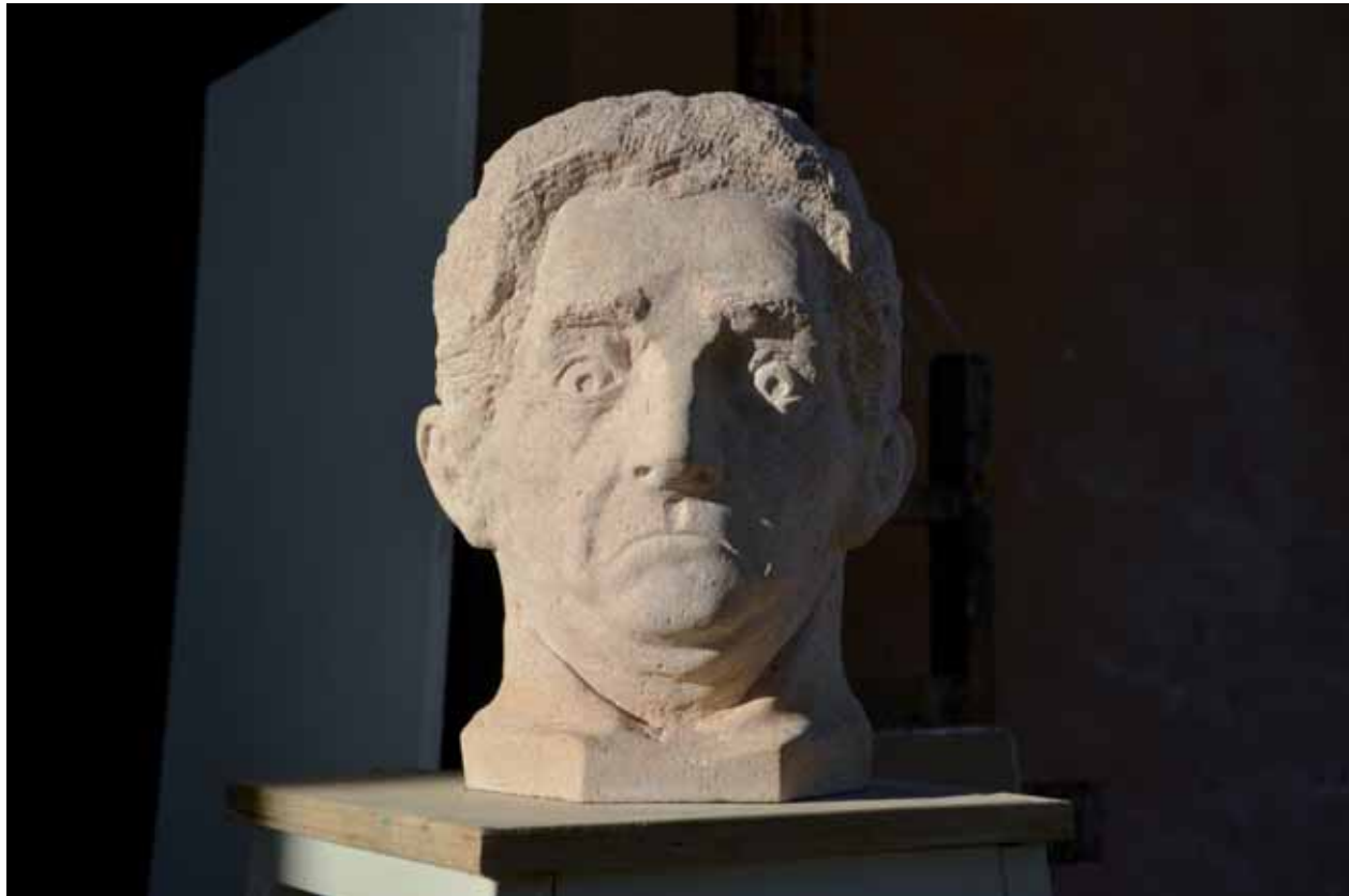
San Cucufato 38 x 35 x 30 cm Arenisca de Sepúlveda