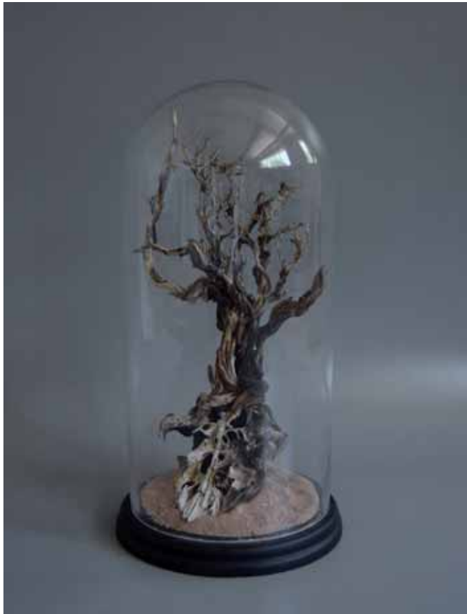
Arqueología de lo hallado. Estudio 6 40 x 20 x 20 cm Técnica mixta. Raíces, huesos y tierra en fanal de cristal