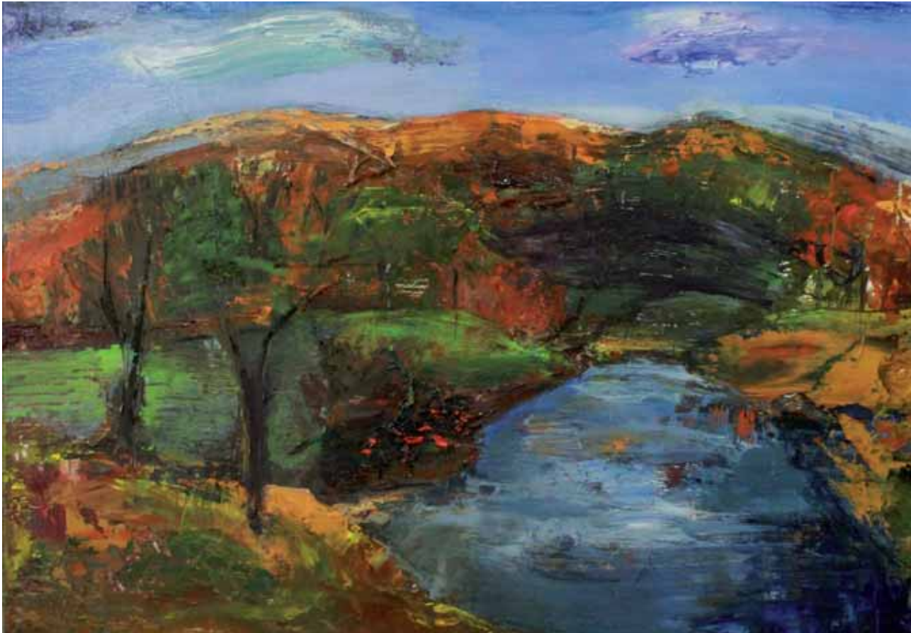
Afuera de Ayllón 40 x 60 cm Óleo sobre tabla