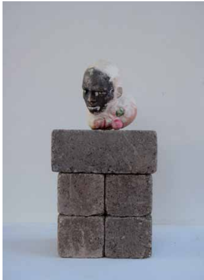
Negro payaso 13 x 11 x 15 cm Escayola policromada