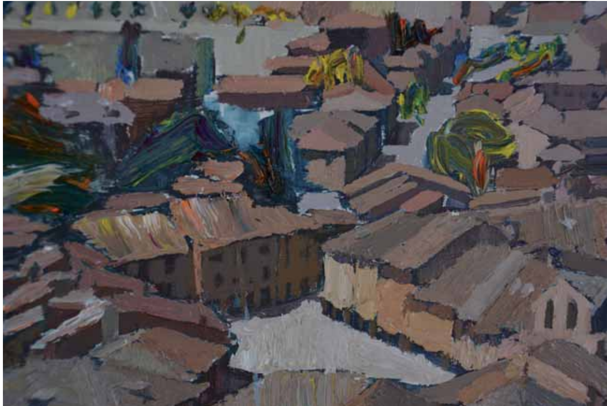
Ayllón. Detalle 100 x 65 cm Óleo sobre lino