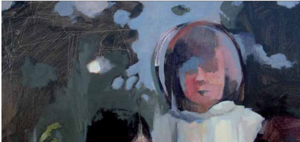
The Aftermath. Detalle 130 x 161 cm Óleo sobre lienzo