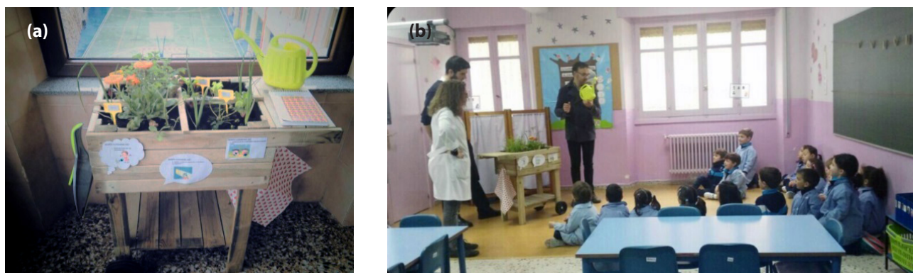
Figura 1. (a) Minihuerto realizado en clase por los alumnos/as, (b) Presentación de los minihuertos.

Por último, existen también iniciativas de ámbito provincial, como es el caso del Programa de Huertos Escolares que desarrolla la Diputación de Cádiz en el marco de los programas de Educación Ambiental, del Área de Desarrollo Sostenible (Cuello 2016). La iniciativa comenzó en 2009, y se originó a partir de experiencias anteriores llevadas a cabo con escolares en los viveros provinciales y en el Centro Agrícola Ganadero, al observarse el desconocimiento que mostraban acerca de los espacios agrarios, la producción de alimentos, el mantenimiento del ganado y en general del sector primario y sus derivados, con independencia del origen rural o urbano de los grupos de escolares. El objetivo general del Programa es facilitar la creación de huertos en los centros educativos, prioritariamente en municipios de población inferior a 2000 habitantes, para que actúen como recursos educativos, se fomente el consumo responsable y la mejora de la convivencia. Así, al inicio de cada curso se hace una convocatoria a la que responden los centros interesados, a los que se distribuyen he-