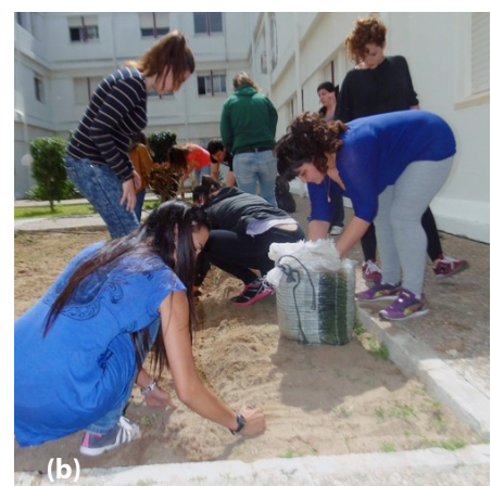
Figura 5. (a) Sistema de bancales del HED utilizado en la Facultad de Educación de Soria (Uva). Fuente: Eugenio (2016) , (b) Estudiantes del Grado en Educación Infantil trabajando en el HED de la Facultad de Ciencias de la Educación (UCA). Fuente: Aragón (2016)