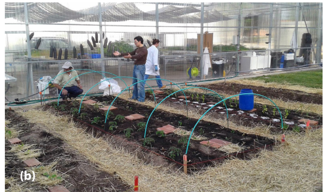
Figura 4. (a) Imágenes de algunas sesiones educativas del proyecto de la UCAV. Fuente: Espinosa et al. (2006) , (b) Sistema de bancales del HE utilizado en la Universidad de Burgos. Fuente: https://www.ubu.es/escuela-politecnica-superior .

tilizantes, diversos sistemas de riego, refugios botánicos para entomofauna, etc., siempre siguiendo los principios de la permacultura.