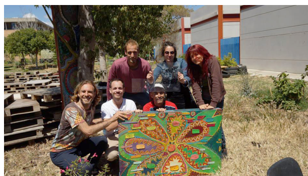
Figura 3. Parte del equipo matriz de Jaulas con la Flor de la Permacultura .

Por otro lado, como iniciativa de los docentes, Departamentos o Centros, quizás con más tradición en titulaciones relacionadas con el medio rural y la producción agroalimentaria, en las que los huertos ecológicos constituyen valiosos recursos para la realización de prácticas en distintas áreas de conocimiento, como Edafología,