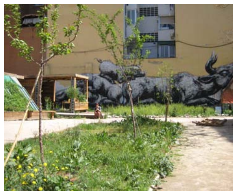
Fig. 3. Zona cubierta de usos múltiples con mural al fondo. Elaborado por Esta es una plaza