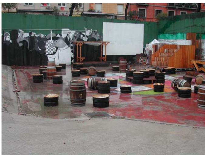
Fig. 7. Campo de Cebada. Teatro al aire libre con gradas y mural al fondo. Elaboración propia.