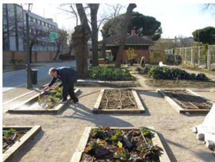
Fig. 10. Huerto del Retiro. Bancales. Elaborada por Huerto Retiro.

Elementos hortícolas: Diversos bancales cultivados en el suelo para huerto autogestionado por los ciudadanos, huerto educativo, huerto familiar y huerto para personas con diversidad funcional.