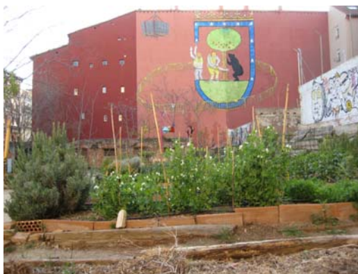
Fig. 2. Bancales con mural al fondo. Elaborado por Esta es una plaza