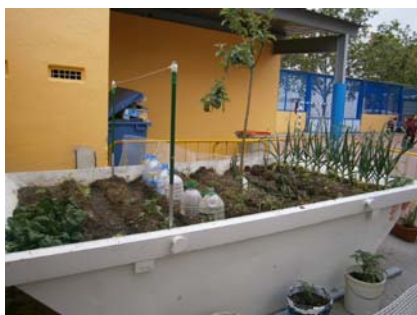
Fig. 12. Huerto en contenedor de escombros.

Elementos constructivos: Campo de fútbol, campo de petanca, arenero con pallets reutilizados, diversas zonas de juegos infantiles diseñados por los niños en un taller organizado por Otro habitat.