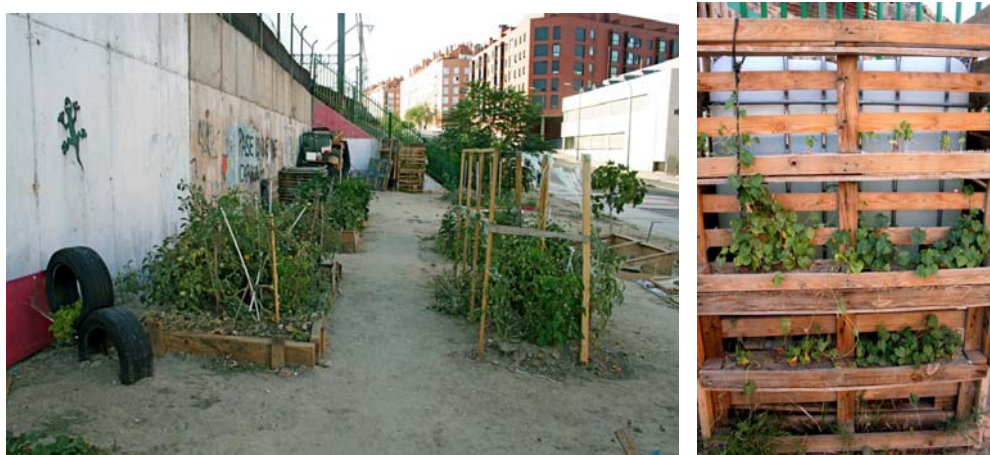
Figs. 22-23. Adelfas. Bancales y Jardinera.