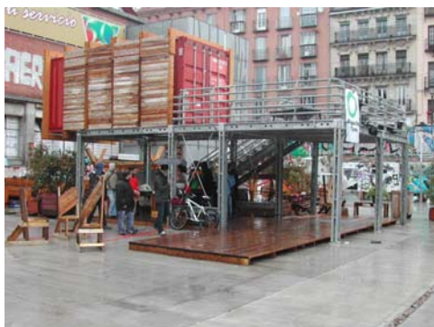
Fig. 8. Campo de Cebada. Dispositivo de usos múltiples. Elaboración propia.