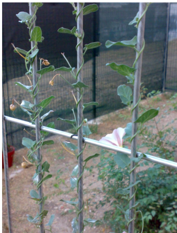
Fig. 24. La vegetación colonizando lo construido. Elaboración propia.