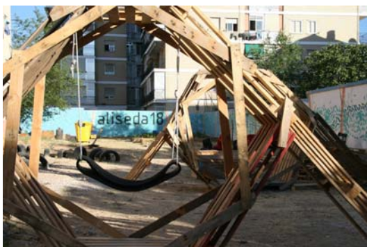
Fig. 18. Elementos representativos de Aliseda 18. Elaboración propia.