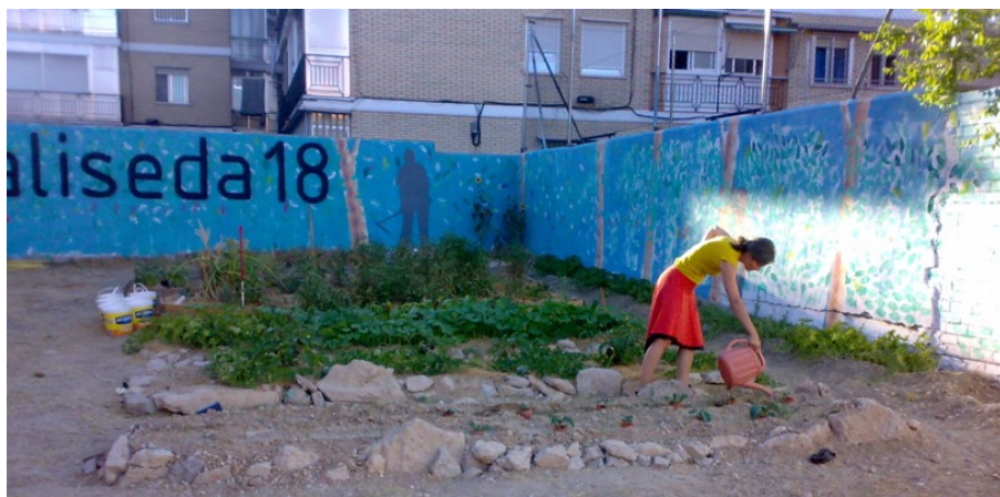
Fig. 16. Bancales con mural al fondo.

Elementos constructivos: Vallado del solar realizado con redondos de obra, zona de juegos de niños reutilizando neumáticos y reciclaje de pallets para zona común pavimentada y composteras-banco, diseñados por AAOO. Elementos representativos de la imagen de Aliseda 18 y sillones ideados en un taller organizado por Basurama y AAOO.