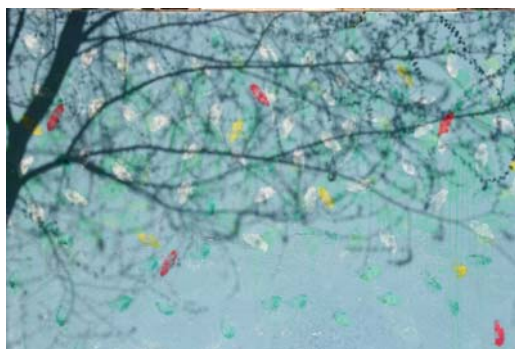
Fig. 17. Fragmento del mural. Elaboración propia.