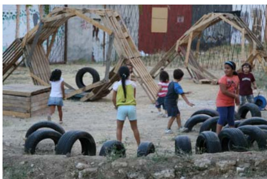
Fig. 19. Zona de juego de niños con compostera, elementos representativos y vallado al fondo. Elaboración propia.