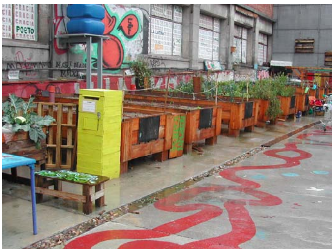
Fig. 6. Campo de Cebada. Bancales elevados. Elaboración propia.

Elementos constructivos: Teatro al aire libre, 5 módulos de gradas ideadas por Paisaje transversal, PKMN, Zuloark, Basurama y Todo por la praxis y dispositivo de usos múltiples ideado por Todo por la praxis.