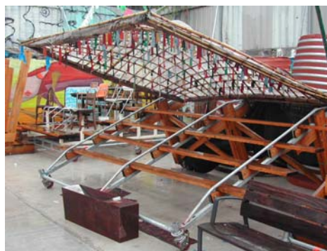
Fig. 9. Campo de Cebada. Dos modelos de gradas con mural al fondo. Elaboración propia.