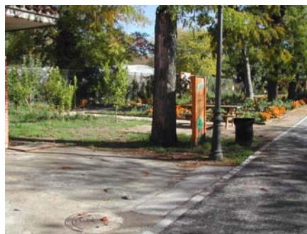
Fig. 11. Huerto del Retiro. Bancales. Elaboración propia