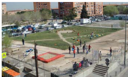
Fig. 14. Vista del parque desde el colegio.