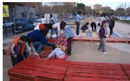
Fig. 15. Construcción del arenero.