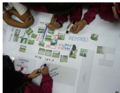
Fig. 13. Proceso de diseño del parque por parte de los niños.