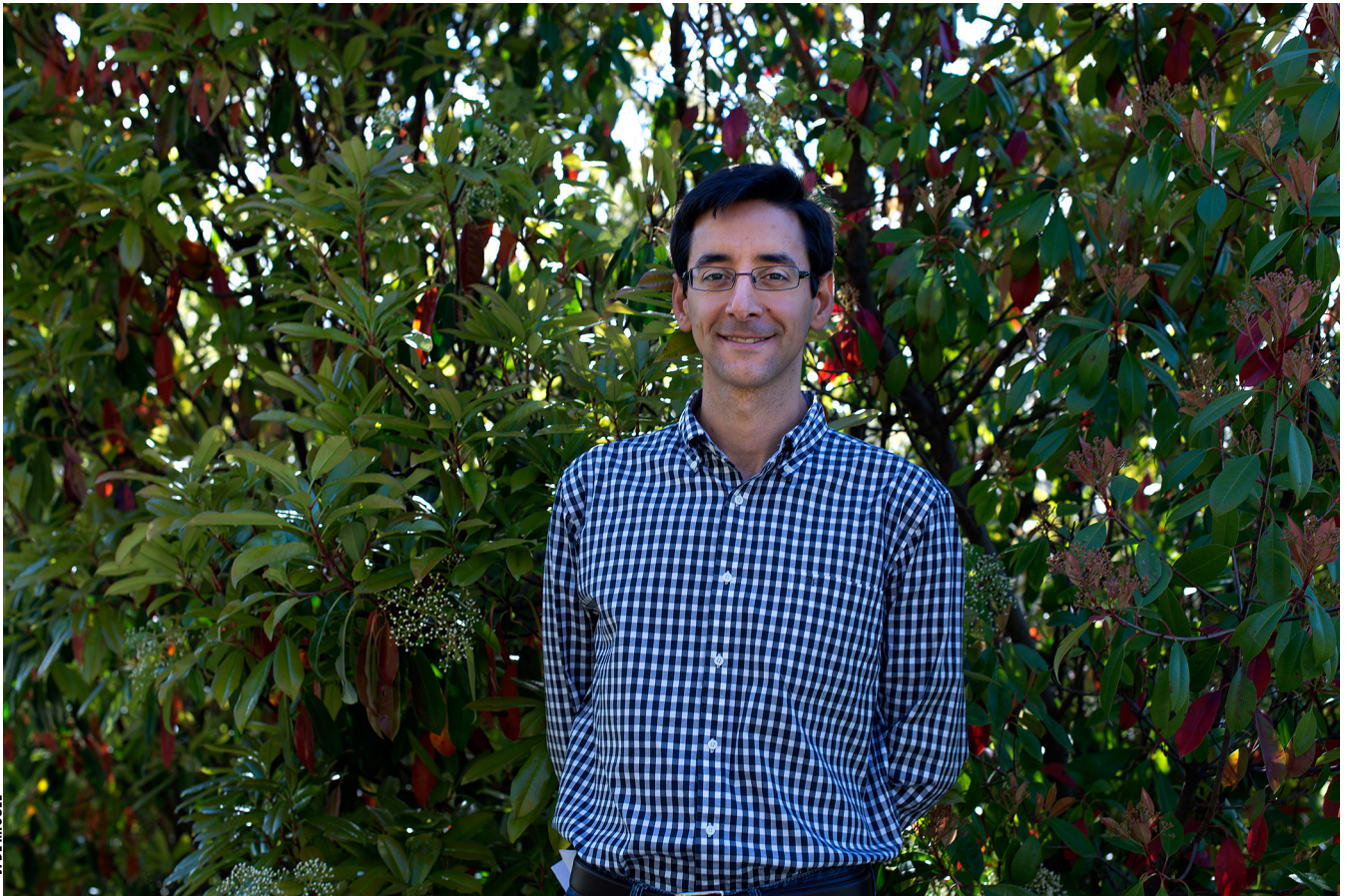
J. DE MIGUEL