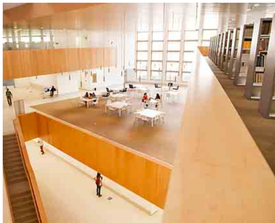
UNIVERSIDAD CARLOS III