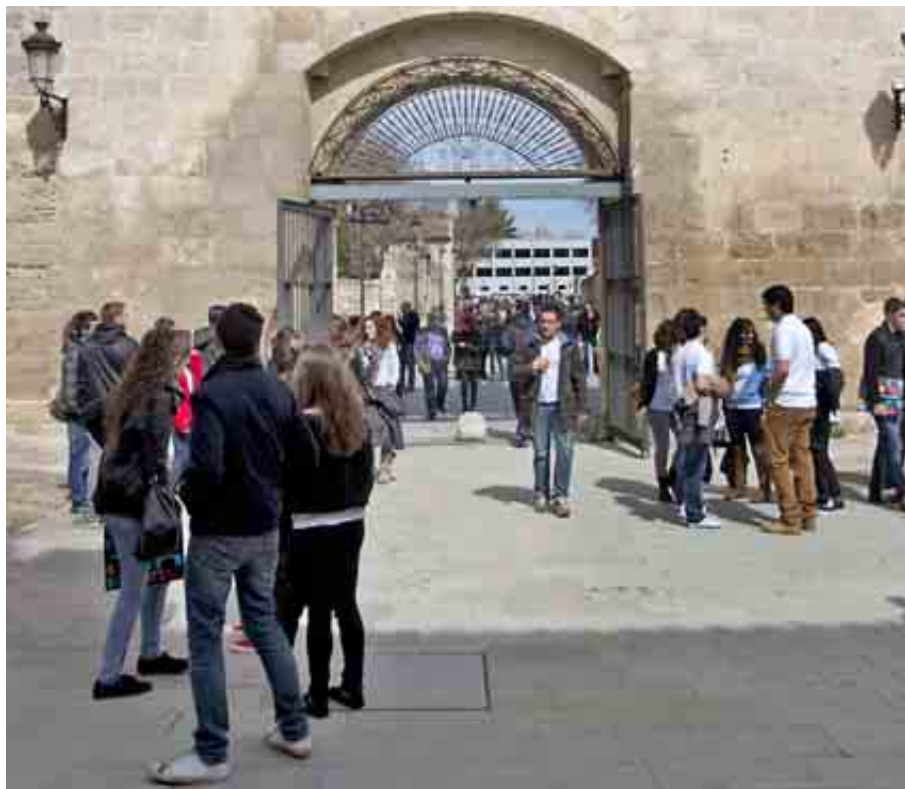
UNIVERSIDAD DE BURGOS