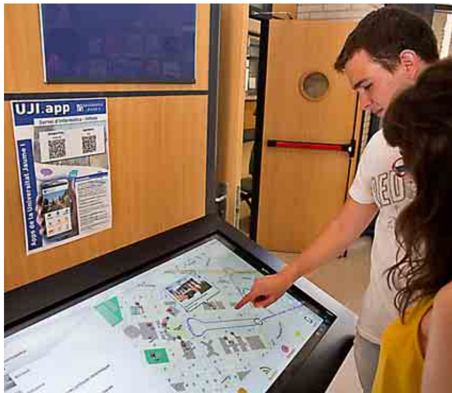
UNIVERSIDAD JAUME I