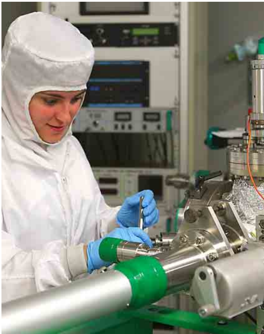
UNIVERSIDAD POLITÉCNICA DE MADRID

Cuenta con el reconocimiento de Campus de Excelencia Internacional Agroalimentario. Oferta un centenar de plazas de nuevo ingreso.