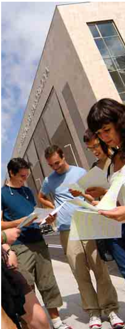
UNIVERSIDAD AUTÓNOMA DE BARCELONA

Para realizar el prácticum cuenta con unas 60 empresas colaboradoras externas, cinco hospitales y tres centros de salud públicos.