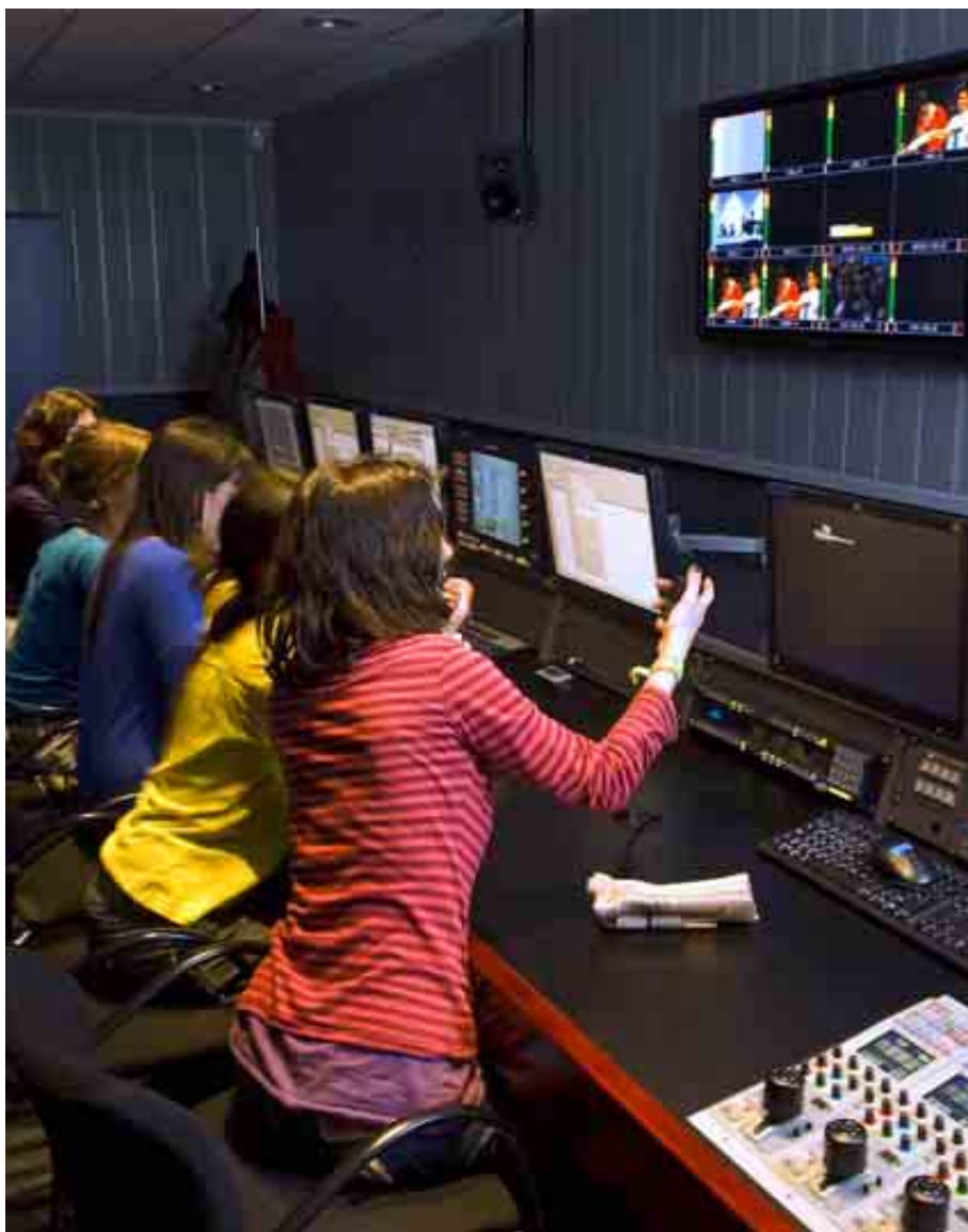
UNIVERSIDAD POMPEU FABRA

Su ubicación en una ciudad con gran tradición de empresas del sector facilita el acceso de los alumnos para realizar prácticas profesionales.