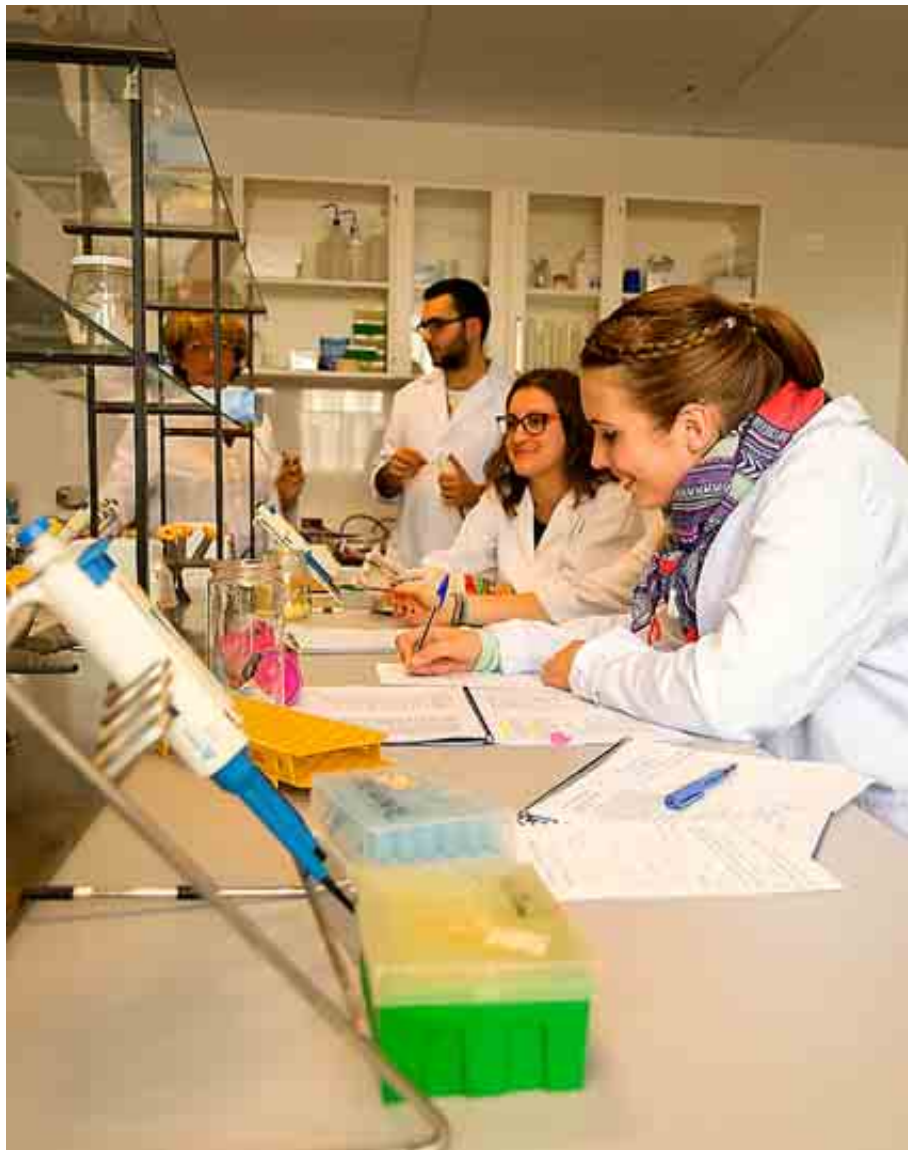
UNIVERSIDAD DE GRANADA

Tiene acuerdos de doble titulación con la Universidad de Varsovia (Polonia), la del Algarve (Portugal) y la del Egeu (Turquía), entre otras.