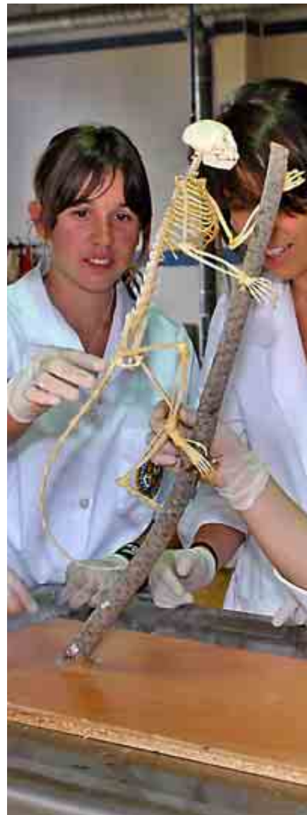
UNIVERSIDAD ALFONSO X EL SABIO

Preside la Red Interuniversitaria de Posgrados en Turismo y colabora con Tourespaña, Segittur y el Consejo Superior de Cámaras.