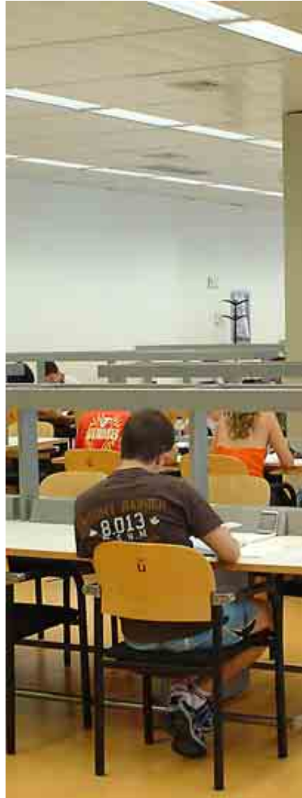
UNIVERSIDAD REY JUAN CARLOS

Dispone de un claustro de buen perfil académico e investigador. Edita la revista Portularia de gran calado en el sector. Incluye 130 plazas