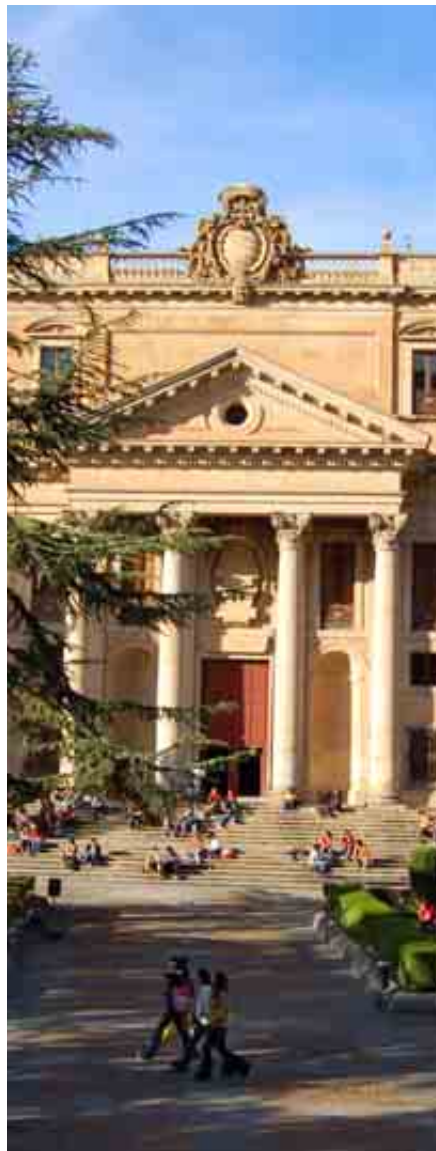
UNIVERSIDAD DE SALAMANCA

Destaca por sus convenios de movilidad internacional y con empresas e instituciones para la realización de las prácticas externas.