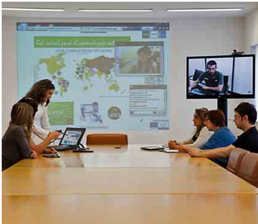
UNIVERSIDAD NACIONAL DE EDUCACIÓN A DISTANCIA

Para el próximo curso 2014-2015, ha incorporado a su catálogo de titulaciones los grados universitarios en Biotecnología e Ingeniería de los Materiales, como «respuesta a las necesidades educativas» de la comunidad y al propio desarrollo de las enseñanzas superiores en la Universidad de Extremadura.