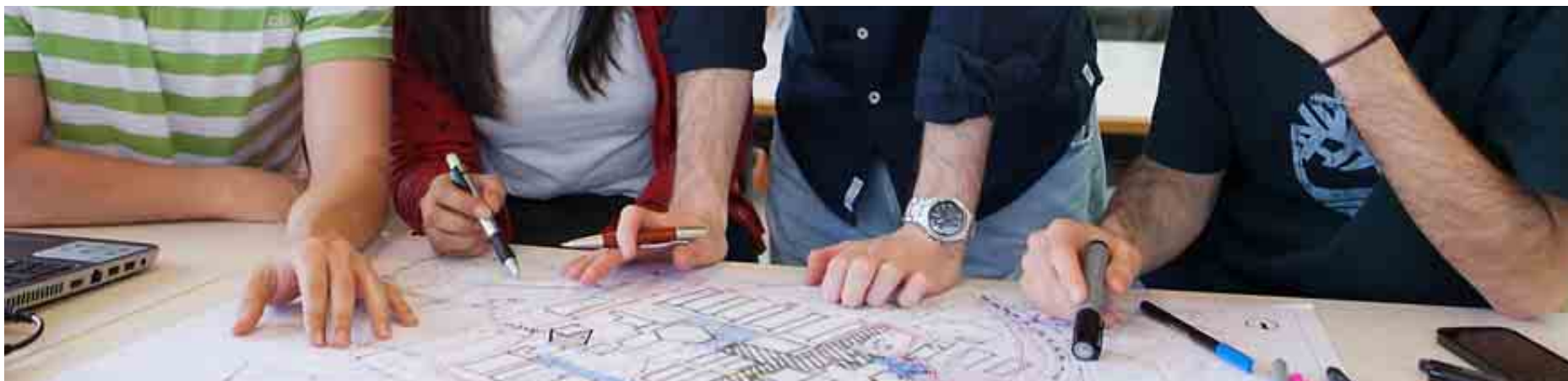
UNIVERSIDAD DE BARCELONA

Todo, o casi, en favor de Ciencias de la Salud, que se espera que alcance el 16,5% del total y que es el ámbito de mayor crecimiento de los últimos años. De hecho, en dos décadas (del curso 92/93 al 12/13) ha visto cómo han aumentado los alumnos en un 112%. Ciencias sigue su caída de estudiantes, casi un punto porcentual respecto al curso pasado y es la única rama, junto con Artes y Humanidades, que ha perdido estudiantes en el histórico de los últimos 20 años. La división simple siempre se ha realizado entre letras o ciencias; sin embargo, la elección de los futuros estudiantes tendrá que ir más allá.