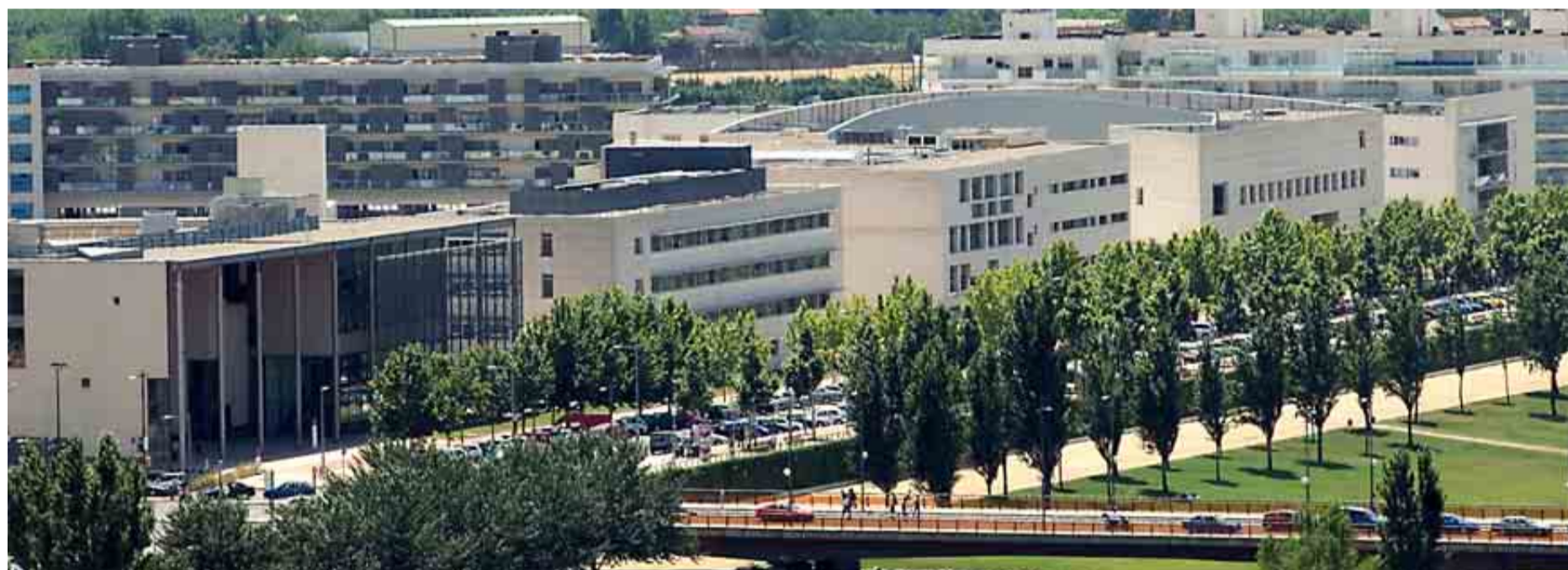
UNIVERSIDAD DE LÉRIDA