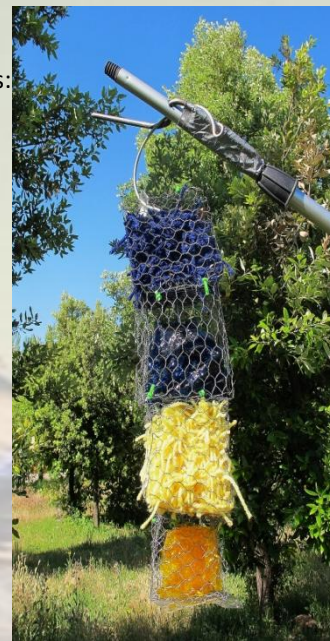
Figura 2: set tipo 2, con lana y plástico azul, lana y plástico amarillo

En los videos no se grabó a ningún ave haciendo uso de los sets. Esto coincide con la falta de variación entre el estado inicial y final de los sets (set tipo 1, p=0.545 ; set tipo 2 p=0.5 ).