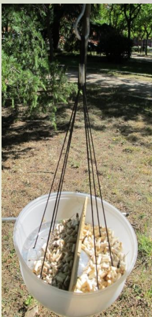
Figura 1: set tipo 1, recipiente con colillas sin y con nicotina