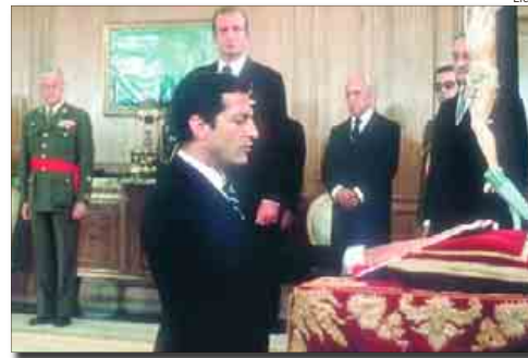
Adolfo Suárez juró el cargo de presidente del Gobierno el 5 de julio de 1976 en el palacio de La Zarzuela en presencia de Don Juan Carlos y de Torcuato Fernández Miranda