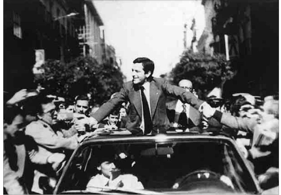
En las generales del 1 de marzo de 1979, Suárez ganó sus terceras elecciones, a pesar de que en las municipales de abril UCD perdió muchas alcaldías por el pacto entre PSOE y PCE