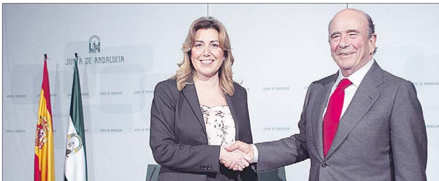
Susana Díaz, presidenta de la Junta de Andalucía, y Emilio Botín, presidente de Banco Santander.

Apli "Matrices" permite a alumnos de educación secundaria y de superior repasar los principales conceptos y operaciones con matrices, a través de una navegación fácil.