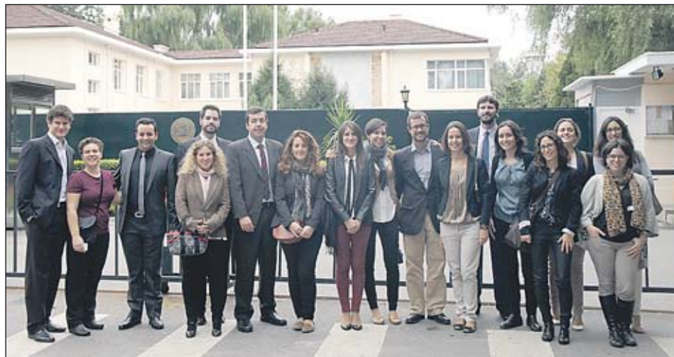
Último grupo de becarios en la embajada de Pekín. EE

UN PROFESIONAL DE SELECCIÓN CON 5.000 CONTACTOS AMPLÍA SU RED A 16 MILLONES, PORQUE EN LAS BÚSQUEDAS APARECEN LOS DE VARIOS NIVELES