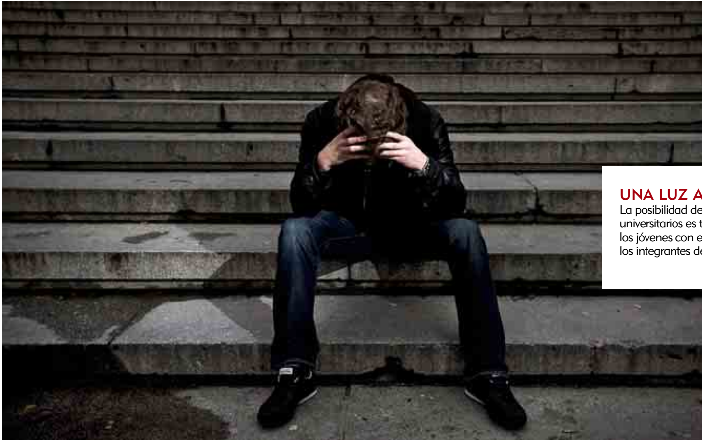
Un joven posa en las escaleras de entrada a la Facultad de Medicina de la Universidad Complutense de Madrid.

ilusión que le ponen al estudio son impagables. Son un auténtico modelo de amor al conocimiento. Ya nos gustaría tener más alumnos así dentro de las aulas», corrobora Gilabert, también profesor de Filología.