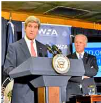
Kerry, secretario de Estado de EEUU, y el vicepresidente Joe Biden.

Directivos de la entidad acompañaron a Joe Biden, vicepresidente del país, y John Kerry, secretario de Estado, en la ceremonia de lanzamiento del programa el pasado día 17 de enero, en Washington. De esta forma, el banco firmará un acuerdo con la fundación Partners of the Americas, una importante organización sin