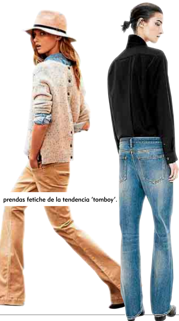
prendas fetiche de la tendencia 'tomboy'.

En esta tercera encarnación de la tendencia, algunas marcas españolas están tomando posiciones para estar en la vanguardia. Es el caso de Mango, que junto con H&M es una de las grandes firmas que se ha atrevido a hacer ropa masculina específicamente para mujeres. Y, a un nivel más pequeño, proyectos como el de la madrileña Según Joe, una firma de tocados que ha comenzado a hacer también sombreros de ala para ellas. En otros 60 años, quizá éstos sean tan habituales en la vestimenta femenina como los pantalones.