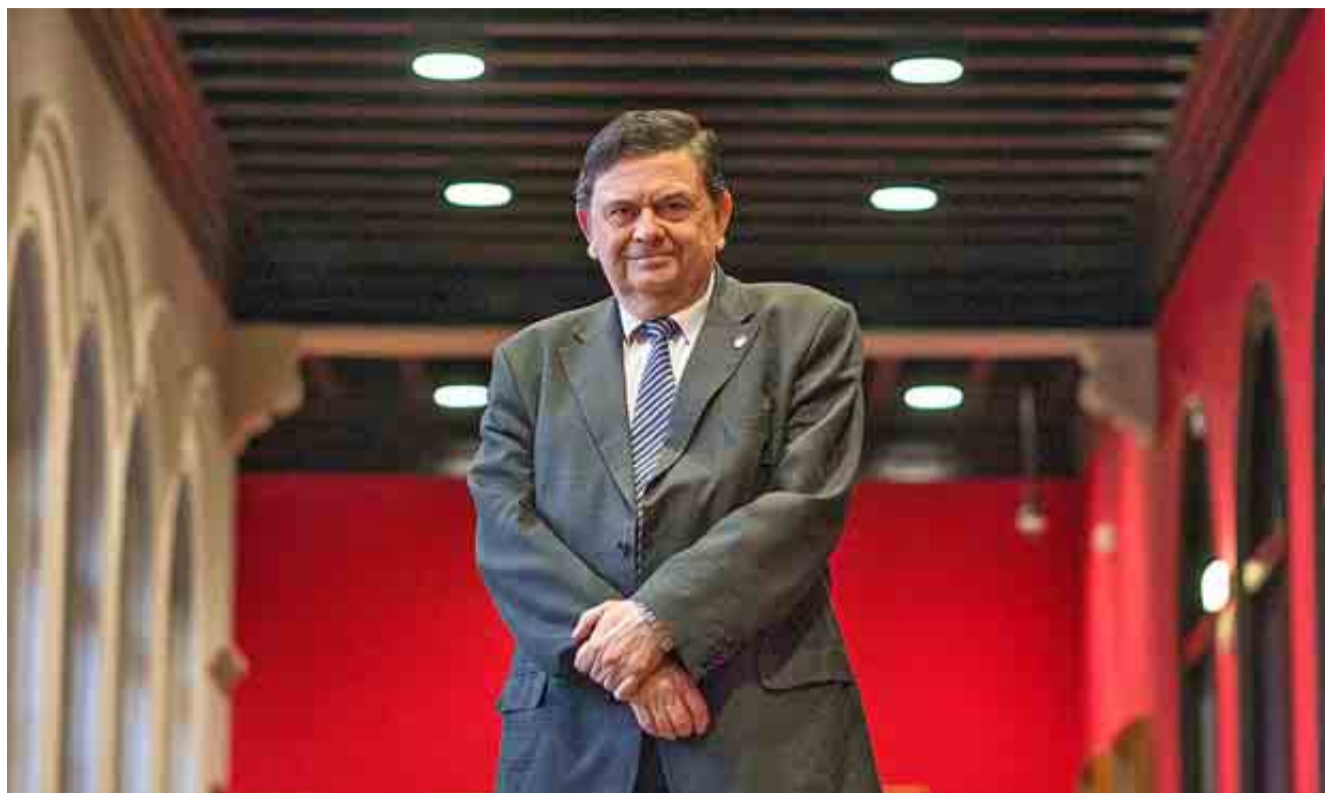
El nuevo presidente de los rectores posa en el Paraninfo de la Universidad de Zaragoza.

Todas estas actividades pretenden determinar los temas y sesiones del III Encuentro Internacional de Rectores Universia, que tendrá lugar en Río de Janeiro los días 28 y 29 de julio de 2014. A esta cita se prevé que asistan 1.100 universidades de 46 países, no sólo de la comunidad iberoamericana, sino también de Europa, Estados Unidos, Rusia, Asia, África y Oceanía.