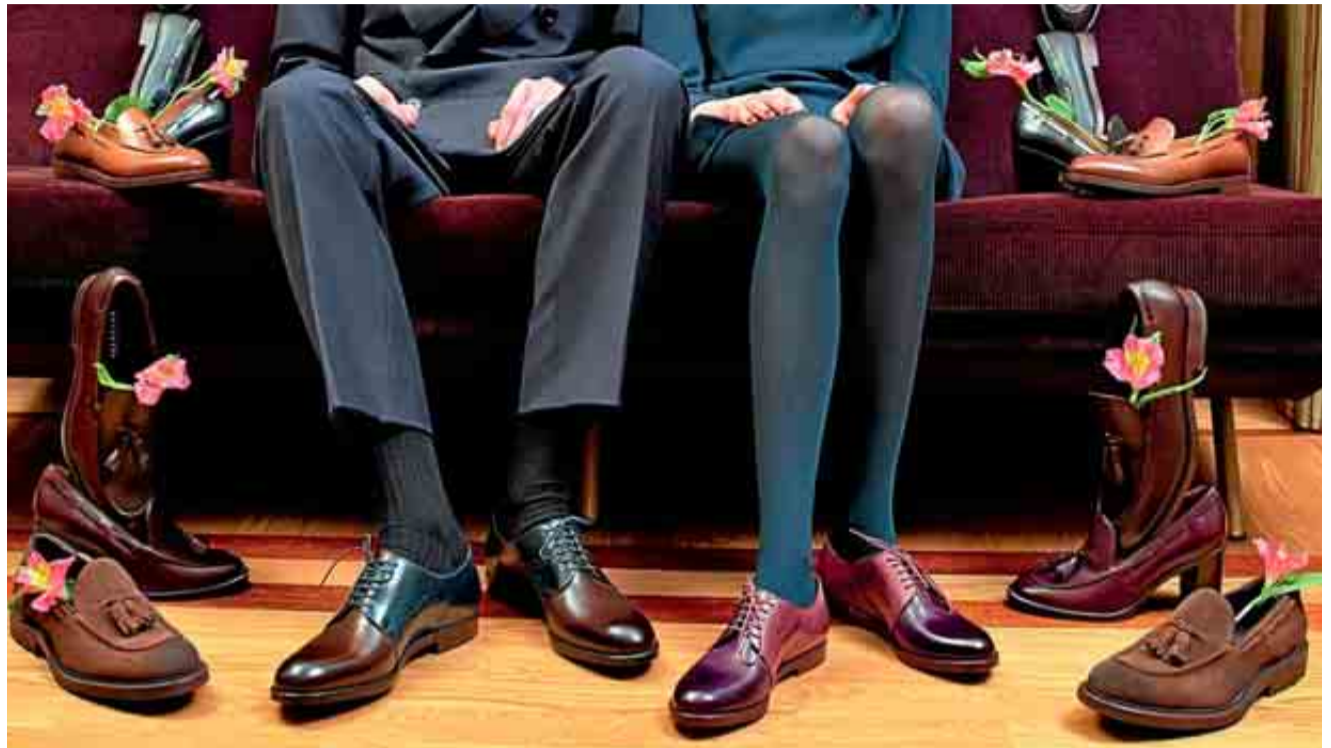
La marca italiana Fratelli Rossetti crea modelos de oxfords prácticamente iguales para hombres y para mujeres.