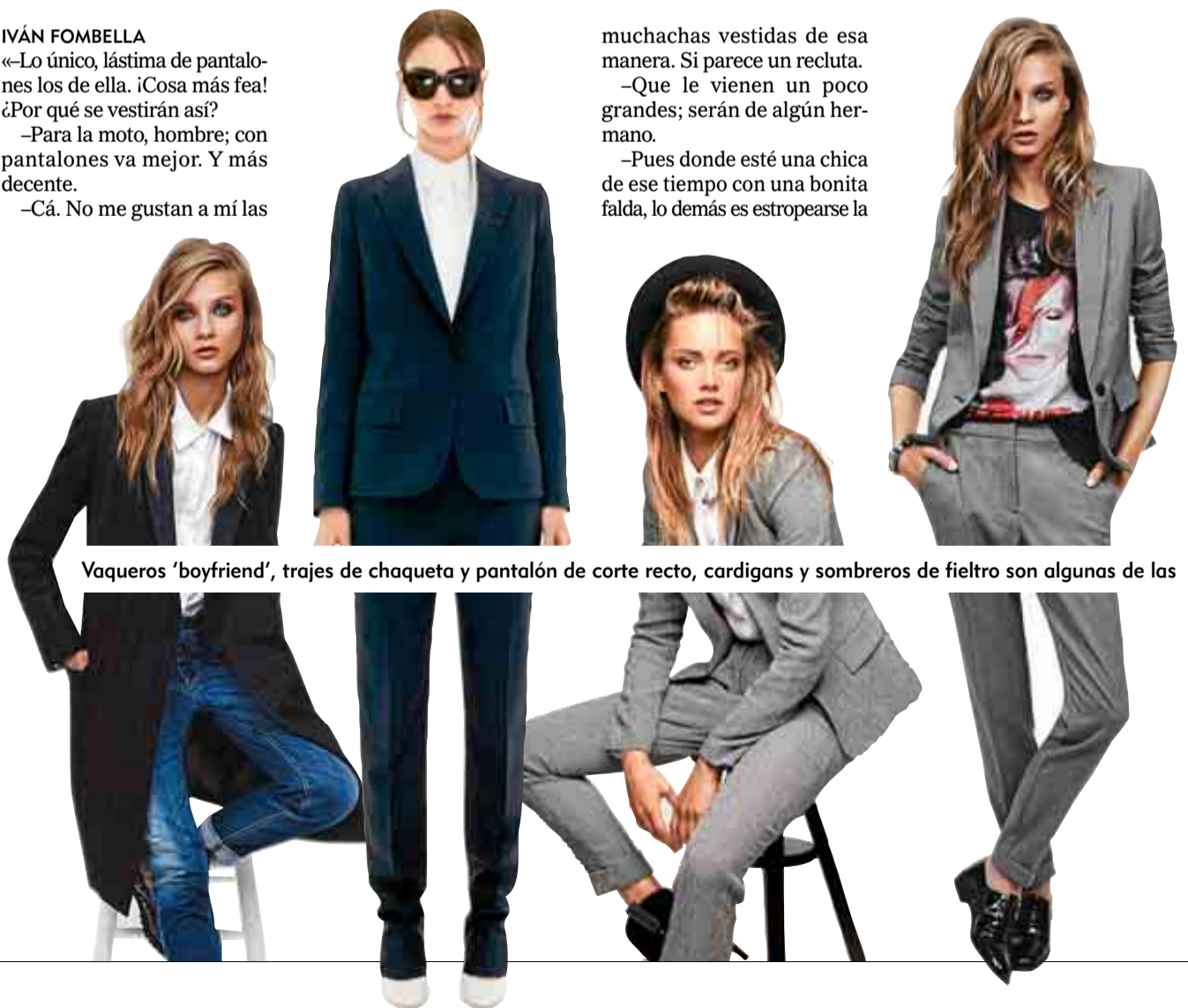
Vaqueros 'boyfriend', trajes de chaqueta y pantalón de corte recto, cardigans y sombreros de fieltro son algunas de las

«Pues donde esté una chica de ese tiempo con una bonita falda, lo demás es estropearse la