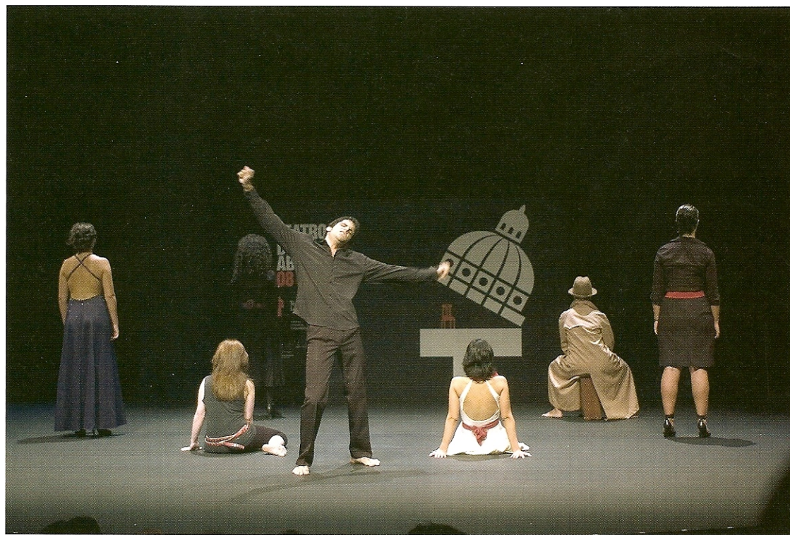
Actores de la RESAD, durante la presentación del Instituto del Teatro de Madrid en La Abadía.

El teatro es una parte importantísima de la tradición cultural española, y hasta el momento no había recibido un merecido reconocimiento oficial dentro del ámbito universitario. Ante esta situación un grupo de profesores de la Universidad Complutense, al que se han unido compañeros de otras universidades madrileñas, como la UNED y la Carlos III, además de investigadores del Consejo Superior de Investigaciones Científicas y varios profesores de la Real Escuela Superior de Arte Dramático de Madrid, propuso al rector de la UCM la creación del ITEM, constituido a fines de 2007 como instituto complutense. El ITEM tiene como objetivo esencial en el campo de la investigación acoger cuantos proyectos traten sobre aspectos históricos, teóricos y prácticos del arte escénico; lanzar una colección de brevariarios sobre teatro y publicar una revista de teatro general y comparado que llevará el nombre de "Pyg-