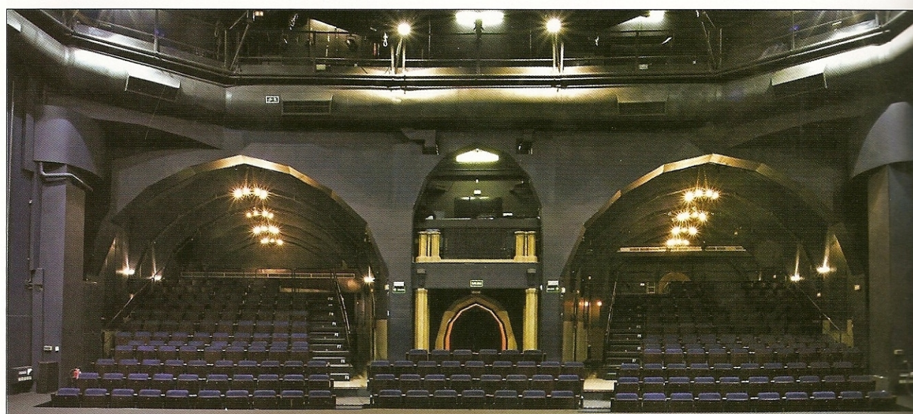
» La presentación del ITEM tuvo lugar en Teatro de La Abadía

El Teatro es una parte importantísima de la tradición cultural española y hasta el momento no había recibi-