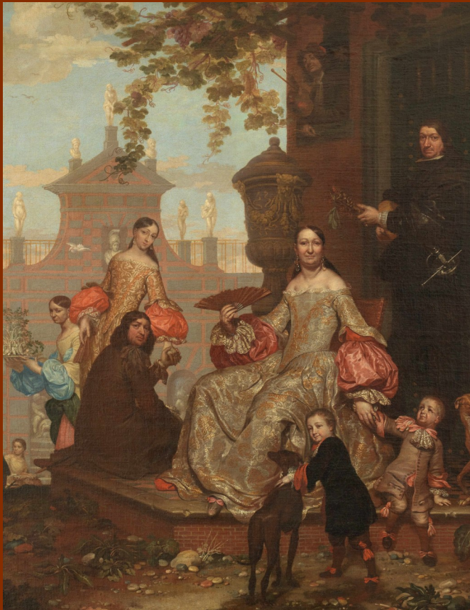
Jan van Kessel II, Familia en un jardín , 1679 Museo Nacional del Prado

Actividad realizada con motivo de la aparición del volumen: