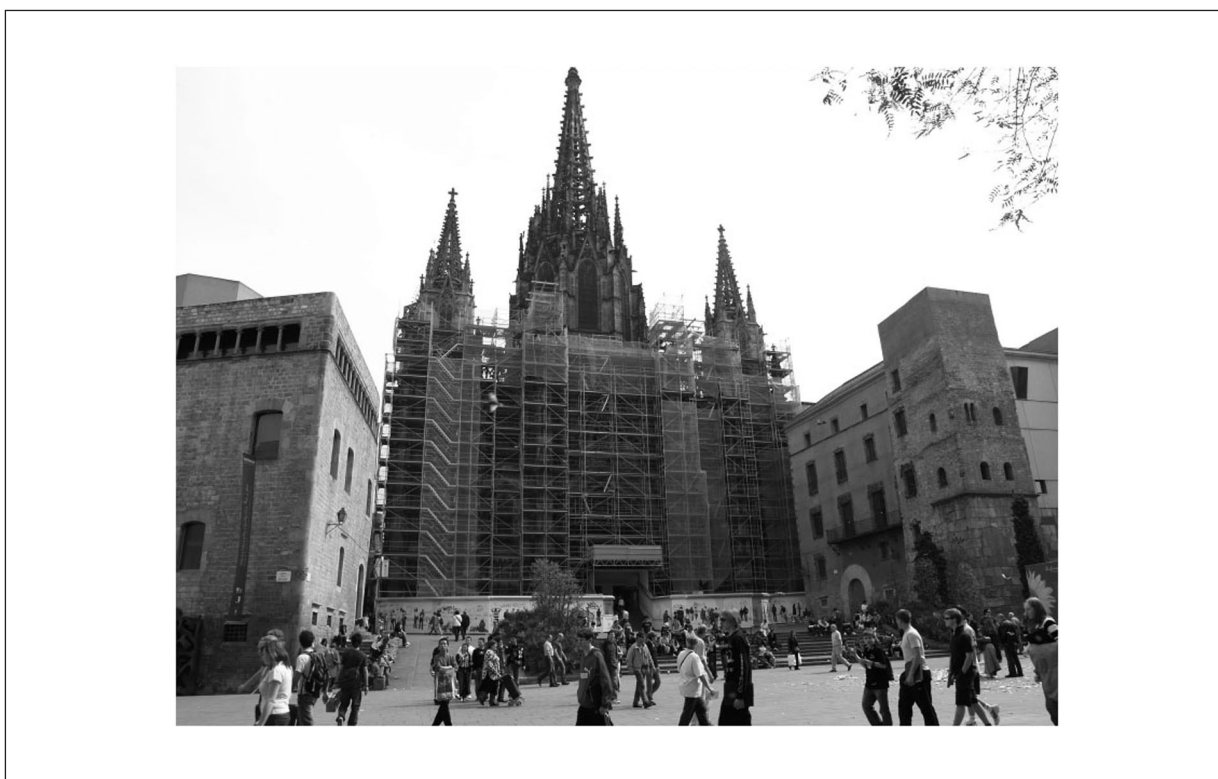
Figura 3 Presión y saturación turística en el Barrio Gótico de Barcelona

En esta dirección se orientan las estrategias de actuación del Plan Director de la Alhambra y el Generalife.