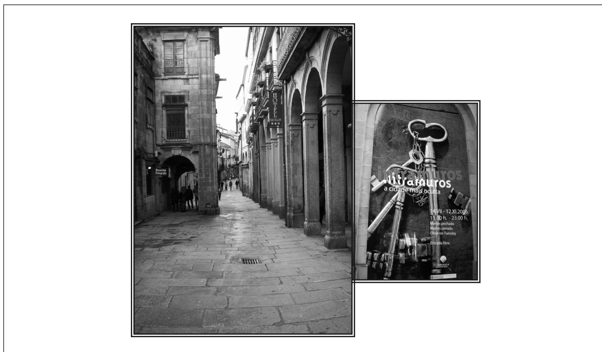
Figura 5 Santiago de Compostela: patrimonio y oferta cultural

La estrategia debe concebirse como un proceso institucional y social de reflexión y concertación que sólo será viable en la medida que sea impulsada y liderada desde las instituciones locales, compartida por los