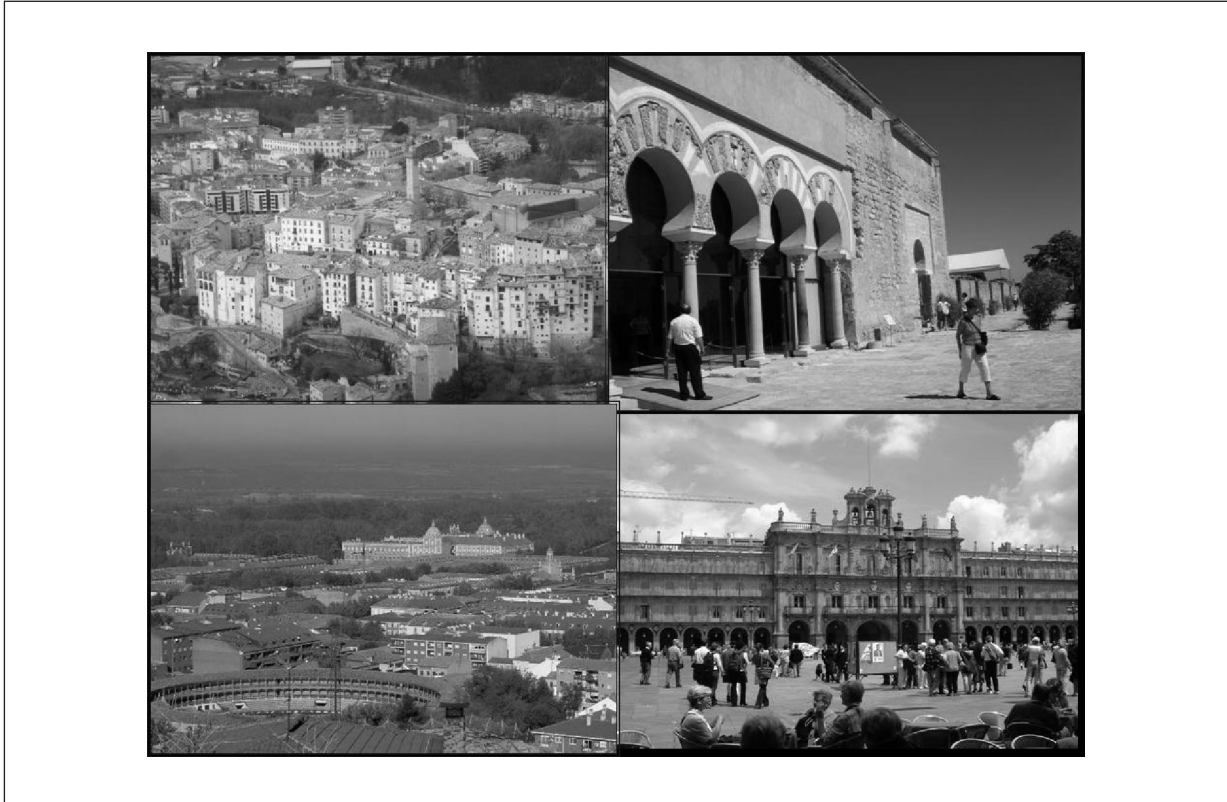
Figura 1 Cuatro referentes turístico-patrimoniales: la ciudad alta de Cuenca, Medina-Azahara, Aranjuez y la Plaza Mayor de Salamanca

medida, se encuentran asociados al turismo. La sostenibilidad se relaciona con el logro de modelos turísticos integrados en la economía y en la sociedad, respetuosos con el patrimonio cultural. La realidad de los destinos patrimoniales españoles es ciertamente muy heterogénea, mientras en pocos casos, Santiago de Compostela, la Alhambra de Granada, Toledo, etc., se plantean situaciones puntuales de congestión, son otros muchos donde existen posibilidades para incrementar el número de visitantes. El turis-