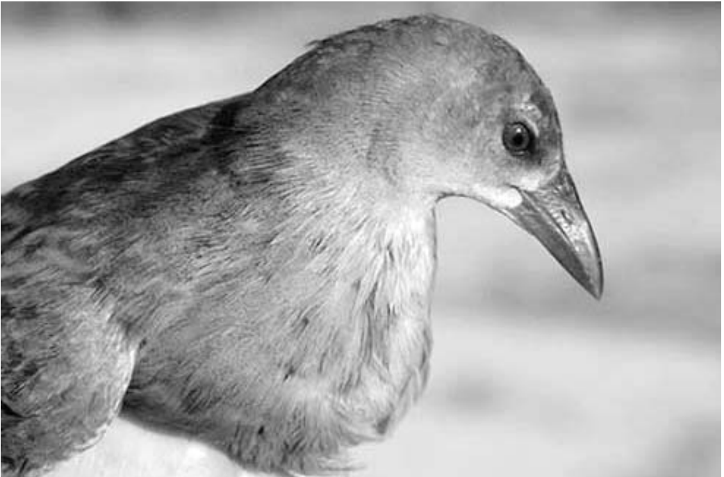
Calamancillo Africano Porphyrio alleni , primer invierno. Benidorm (Alicante), febrero de 2002.