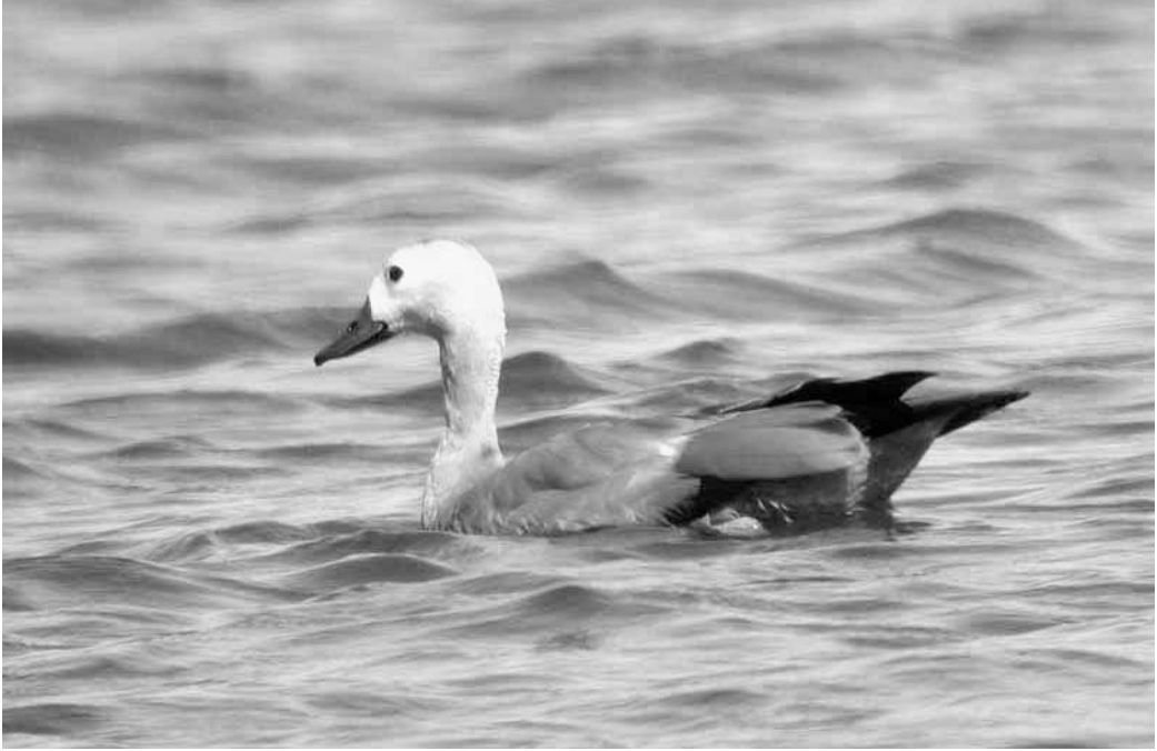
Tarro Canelo Tadorna ferruginea , hembra adulta. Azud de Riobobos (Salamanca), julio de 2002.