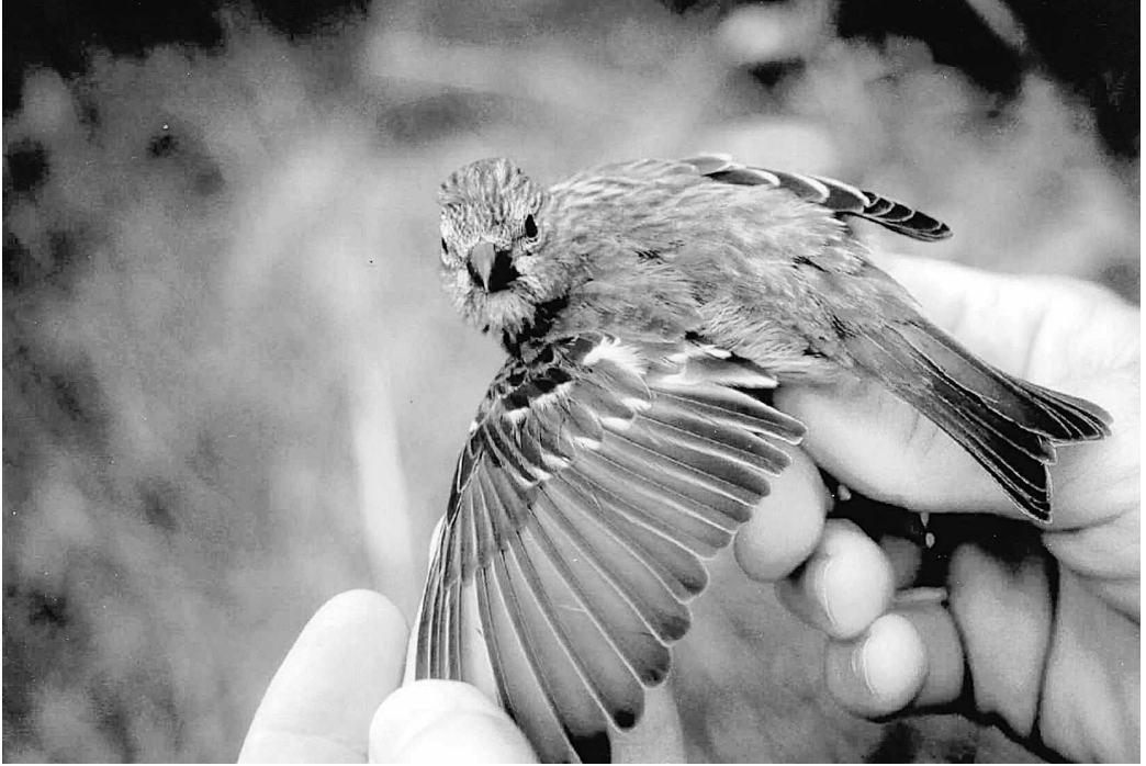
Camachuelo Carminoso Carpodacus erythrinus , juvenil. Ceuta, septiembre de 2002.

(Norte y centro de Europa, y Asia). La de Ceuta es la primera observación que homologamos para el norte de África. Para Marruecos se conocen dos, en Oualidia, octubre de 1980, y en el estuario del Mas-sa, enero de 1994 (Thévenot et al. , 2003).