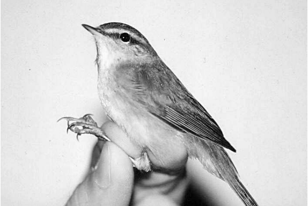
Mosquitero Sombrío Phylloscopus fuscatus . Vilanova de la Barca (Lérida), noviembre de 2001.

(Europa central y oriental y Asia). La de Ciudad Real es la primera observación homologada para Castilla-La Mancha y todo el interior peninsular. La de Málaga es extraordinariamente temprana (casi todas nuestras observaciones de otoño caen entre mediados de septiembre y finales de octubre).