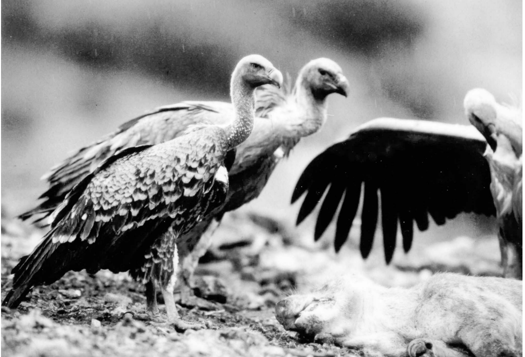
Buitre Moteado Gyps rueppellii , subadulto. Montejo de la Vega de la Serrezuela (Segovia), marzo de 2002.