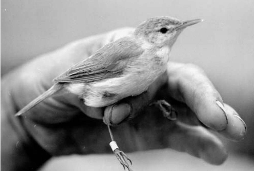
Carricero de Blyth Acrocephalus dumetorum . Brazo de la Torre (Sevilla), septiembre de 2001.