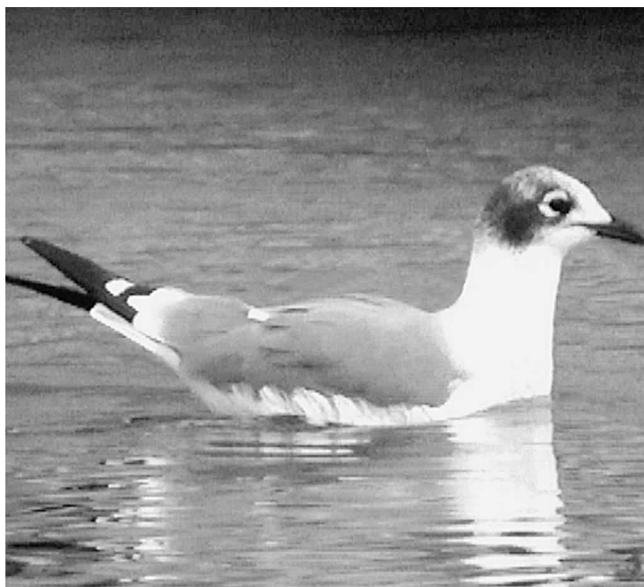
Gaviota Pipizcan Larus pipixcan , segundo invierno. Rivas-Vaciamadrid (Madrid), septiembre de 2002.

A Coruña. A Coruña, ría de O Burgo, 1.º verano, 18 de marzo (R. Salvadores Ramos, T. Salvadores Ramos y C. Vidal Rodríguez).