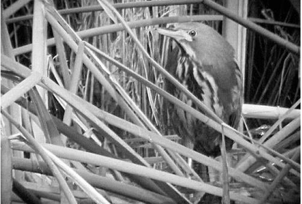
Avetorillo Plomizo Ixobrychus sturmii , macho. Charca de Erjos (Tenerife), agosto de 2002.

Sevilla. Puebla del Río, entre los poblados de Alfonso XIII e Isla Mayor, probable 2.º año calendario, fotos, 19 y 20 de enero (J. Ruiz Carmona) y 14 de febrero (F. Chiclana Moreno, J. Garzón Gutiérrez y M. Martín). Villafranco del Guadalquivir, finca Veta la Palma, ad., 27 de febrero (F. Chiclana Moreno). Puebla del Río, Isla Mayor, 1.º verano o ad., 31 de agosto (J. Butler y otros).