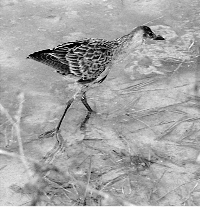
Calamancillo Africano Porphyrio alleni , primer invierno. Porres (Mallorca), enero de 2002.