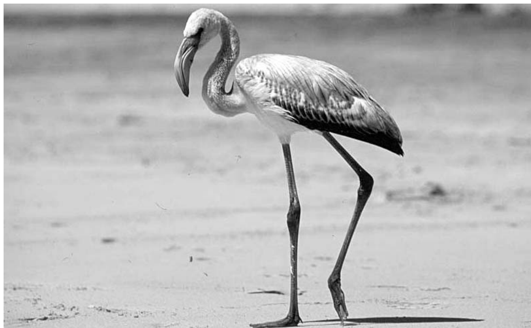
Flamenco Común Phoenicopterus roseus , juvenil. Jandía (Fuerteventura), septiembre de 2002. Foto: A. Betoret.

Santa Cruz de Tenerife. Isla de La Palma, puerto de Tazacorte, tres juvs., foto de uno, aparecen con síntomas de agotamiento y son atendidos en el Centro de Rehabilitación de Fauna Silvestre del Cabildo Insular (uno muere a los pocos días), 12 y 13 de agosto (F. M. Medina/Unidad de Medio Ambiente del Cabildo Insular de La Palma); misma localidad, juv., encontrado muerto, 19 de agosto (F. M. Medina/Uni-