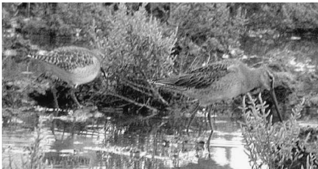
Agujeta Escolopácea Limnodromus scolopaceus , primer invierno. Parc Natural de S'Albufera (Mallorca), octubre de 2002.

(NE de Siberia y extremo N de Norteamérica). Primera cita para las Baleares (véase Stagg, 2003), pese a que de las nueve homologadas para la Península tres correspondían ya al litoral mediterráneo. Curiosamente, en Francia las citas de esta especie se distribuyen sin excepción por el litoral atlántico y del orden del 70 % aparecen concentradas en el departamento más occidental de todos, Finistère (Dubois et al. , 2000).