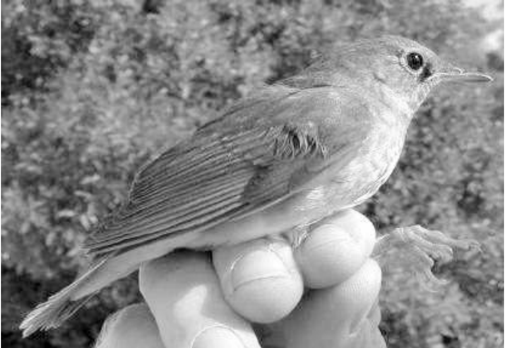
Ruiseñor azul Luscinia cyane , macho de primer invierno. Delta del Ebro (Tarragona), octubre de 2000.

Alström et al. , 1991). Sin embargo, dos observaciones británicas han seguido muy de cerca a la nuestra, con fechas 23 de octubre de 2000 y 2 de octubre de 2001 (Rogers et al. , 2002). Las áreas de invernada de esta especie asiática oriental se extienden desde el suroeste de la China hasta Birmania, islas Filipinas, Borneo y Sumatra, y su paso otoñal en China tiene lugar entre septiembre y principios de octubre (Cramp, 1988). Véase nota sobre la presente observación, con fotos, en Bigas & Gutiérrez (2000).