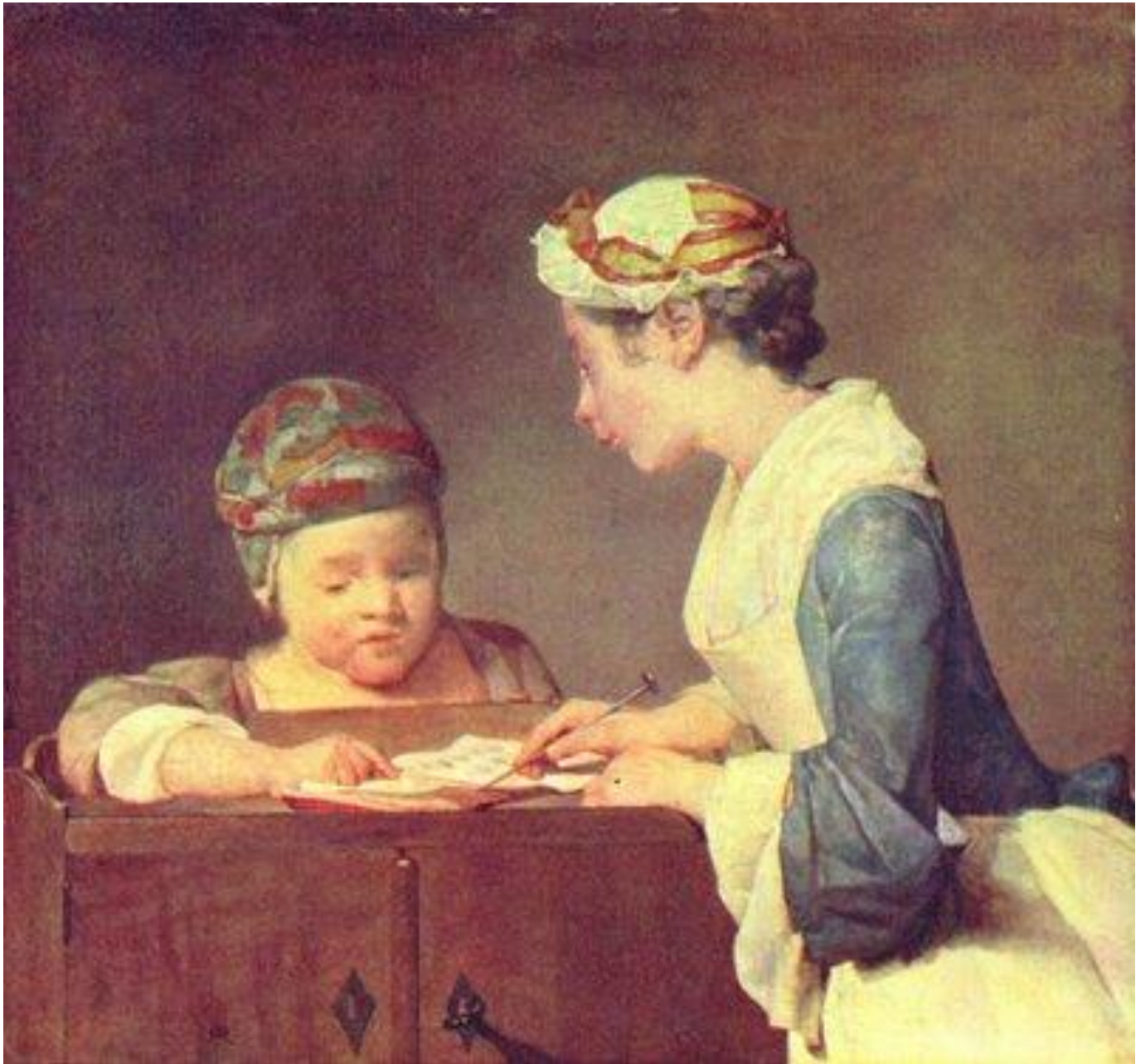
NIÑAS APRENDIENDO - NESKAK IKASTEN JEAN BAPTISTE S. CHARDIN (1699-1779)