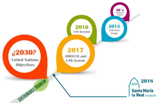
Figura 1. Línea del tiempo con la actividad de cada proyecto (diseño del alumno)

In conclusion, it is definitely a task of a well prepared Cultural Heritage manager to know how to recognize all the different opportunities and threats that can appear over the action area under his responsibility. In the same way, all the study process done for the actual published tools and the proposition made with the design of a new indicators group for a good and sustainable management of the Cultural Heritage can both be considered a good support to help them in their job. That means a necessary and useful documentation for several organizations, enterprises, public administration, entities, municipalities, regional governments and all those who are responsible and take part into the making decisions processes for the establishment of future policies for all these topic questions. It can be also possible that, in this continuous changing reality, some adaptation problems for the new objectives and solution may appear. However, it will always necessary the involved participation of previous referent pilot examples, which will be used as a pattern for the future implementation replicability in order to solve similar situations. In consequence, a summary analysis of the most recent tools and toolkits in the present is explained, being all of them synthetized and revised in terms of management, planning, development and sustainability for the best and adequate preservation under the 21 st century conditions for our most appreciated wealth, the Cultural Heritage.