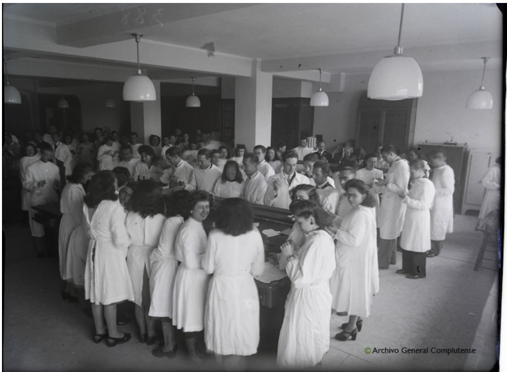
Foto 1: Vista general de la Facultad de Medicina. [1940-1950]