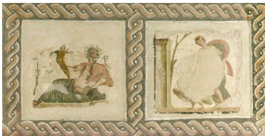
Figura 7. Detalle del Mosaico de la Villa de Baccano en el que se aprecia a la izquierda la divinidad fluvial y a la derecha a Leda con el cisne. Museo Nazionale Romano. Siglo IV.