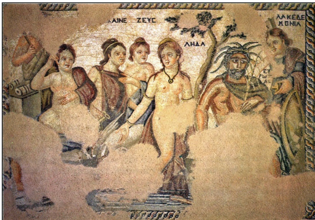
Figura 9. Panel en el que se representa el mito de Leda y el cisne, en el que figuran el río Eurotas y Lacedemonia, entre otros personajes. Ubicado in situ en la Casa de Aion, Nea Paphos, Chipre. Siglo IV (Fuente: Olszewski, 2013, fig.8, pl. LXXIX).

personajes femeninos que aparecen en la escena. Este autor las ha identificado como siervas de Leda ( Therapaine ) que la ayudan en su baño. Por otro lado, según este autor, la figura femenina semidesnuda, que se toca el vientre con la mano izquierda haciendo alusión a un posible embarazo, podría ser una personificación o diosa de la concepción. Tampoco descarta que se trate de Sémele, madre de Dioniso, ya que el mosaico en su totalidad se relaciona con el dios (Olszewski 2013: 213) y a su vez podría explicar la presencia del sátiro.