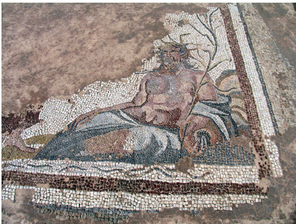
Figura 5. Detalle del mosaico de Mediana en Nis (Serbia) en el que vemos al río Eurotas. Villa de Mediana en Nis, Serbia. Conservado in situ desde 1972-1977. Siglo IV. Medidas: 9, 5 m 2.