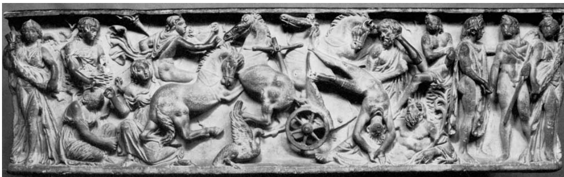
Figura 1. Sarcófago de mármol en el que se representa la caída de Faetón, presenciada por el río Eridano. Galería de los Uffizi de Florencia. Siglo II (Fuente: Limc "Eridanus", I, 1: Erika Simon, tomo 2, p. 594).

los mitos en los que las personificaciones de los ríos aparecen con este carácter en la musivaria romana. Estos, cuentan con una vasta tradición iconográfica y sus diferentes escenas han sido representadas en el arte pictórico ya desde época arcaica en los vasos griegos hasta la pintura al óleo de la Edad Moderna. Se trata, por tanto, de los mitos de Apolo y Dafne, el de Heracles y el centauro Neso, el mito de Marsias 4 , y por último, el mito de Leda y el cisne, representado con frecuencia en la musivaria. Así pues, a continuación revisaremos aquellos mosaicos en los que se representa este tema en el que el río aparezca personificado.