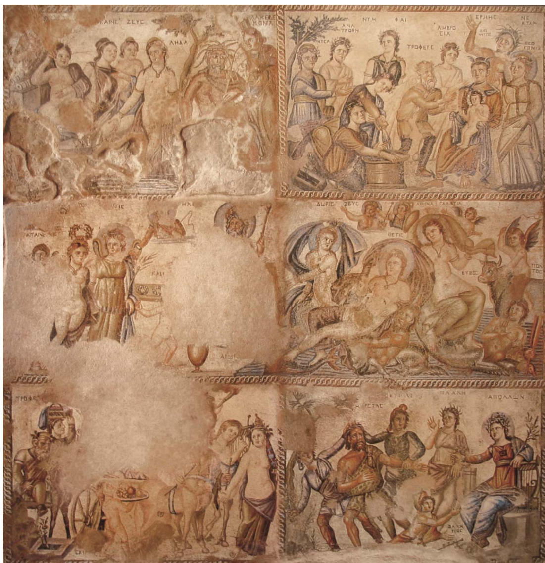
Figura 8. Vista general del Mosaico de la Casa de Aion en Nea Paphos, Chipre. Conservado in situ . Siglo IV. Medidas: 3, 9 x 3, 9 metros.

representados en el panel, se identifica por los tituli en griego.