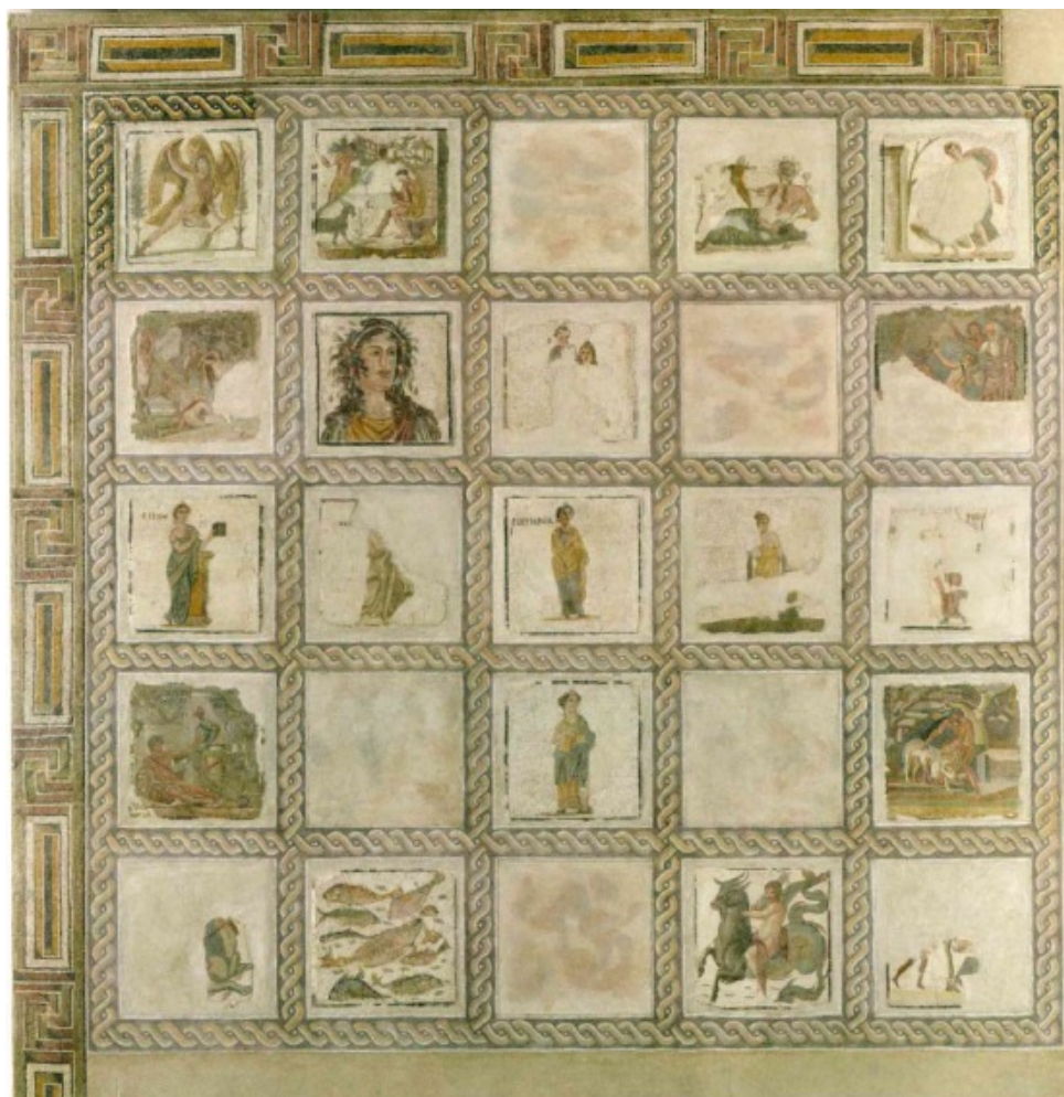
Figura 6. Mosaico de casetones con las musas y escenas mitológicas procedente de la Villa de Baccano. Museo Nazionale Romano. Siglo IV (Fuente: Guidone, 2012, p. 275, fig. 22.3).