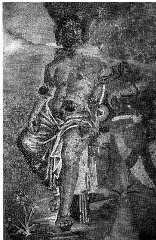
Figura 2. Representación del dios-río Eurotas. Museo de Tazoult-Lambèse, Argelia. Siglo III (Fuente: San Nicolás Pedraz, 1999, p. 350, fig. 1).

agua, mientras que la figura misma se sitúa dentro de su propia corriente fluvial, donde también se aprecian plantas acuáticas en la esquina inferior izquierda. A su lado aparece Zeus transformado en cisne siguiendo a Leda, quien aparece desnuda (Linant de Bellefonds 1992: 236) y con los brazos levantados. Finalmente, como es frecuente en este tipo de representaciones, la figura infantil de Eros se sitúa a la izquierda de la joven y porta una antorcha, como símbolo de pasión amorosa (San Nicolás Pedraz 1999: 349).