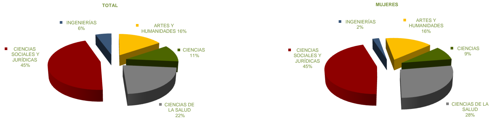
ALUMNADO DE GRADO Y TITULACIONES A EXTINGUIR DE FACULTADES DE LA UCM POR RAMAS DE CONOCIMIENTO. 2017-2018

* No están incorporados los estudios de Doble Grado. Estos se muestran en un cuadro más adelante por poder pertenecer a más de una rama de conocimiento.