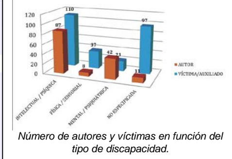
Número de autores y víctimas en función del tipo de discapacidad.