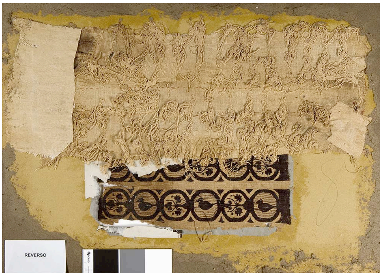
Fig. 3. Reverso de cartón (15073 y 15074).