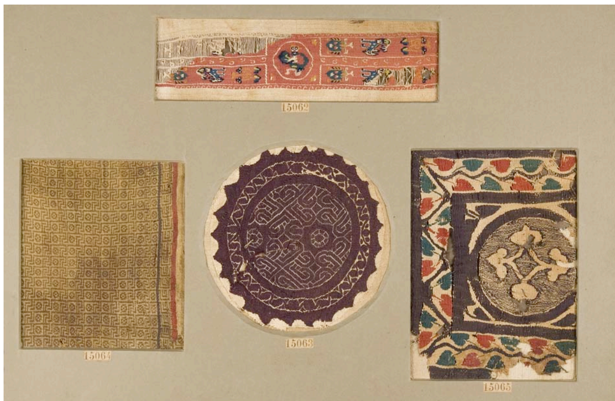
Fig. 2. Montaje de cartón con tejidos en ventanas (anverso).