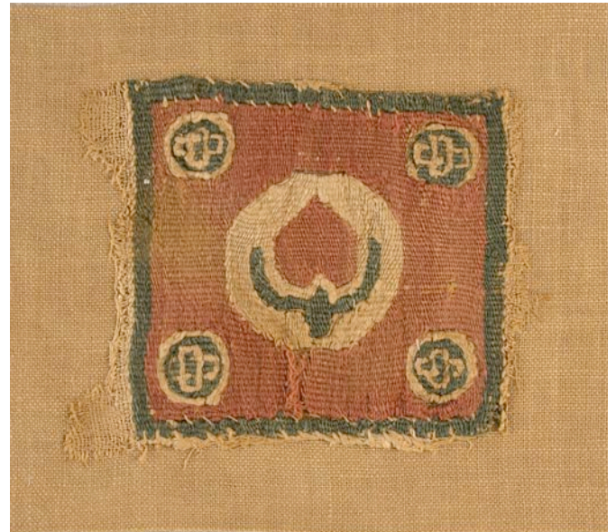
Fig. 6. Tabula (1992/39/1).