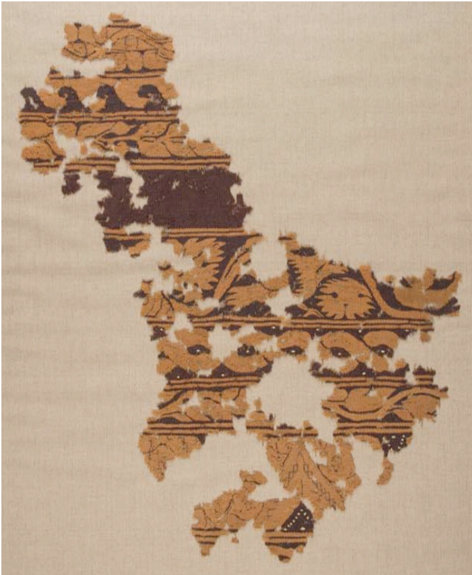
Fig. 5. Tapicería con decoración en bandas (16226).

el expediente donde están recogidos (1976/130) se encabeza como «Relación de telas de distintas épocas y procedencias, algunos sin ellas, que forman parte del MAN y carecen de n.º de inventario». En todo caso, como ya se ha comentado, es de gran interés que este Museo nacional fuese el primero en adquirir una colección de piezas que en ese momento suponían una de las novedades más importantes en las campañas de excavación que se estaban llevando a cabo en Egipto. Como también llama la atención que a pesar de la compra tan temprana del grueso de la colección no se mostrara interés por incrementarla posteriormente, siendo el periodo más floreciente para estas adquisiciones entre finales del siglo XIX y la I Guerra Mundial, coincidiendo con la exposición de los hallazgos de Gayet en la exposición de 1900 de París (Gayet, 1900) y las distintas campañas llevadas a cabo por museos, universidades y excavadores de Europa y Estados Unidos.