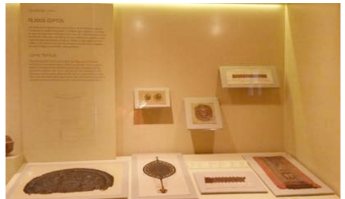
Fig. 7. Muestra de tejidos coptos en el actual montaje expositivo.