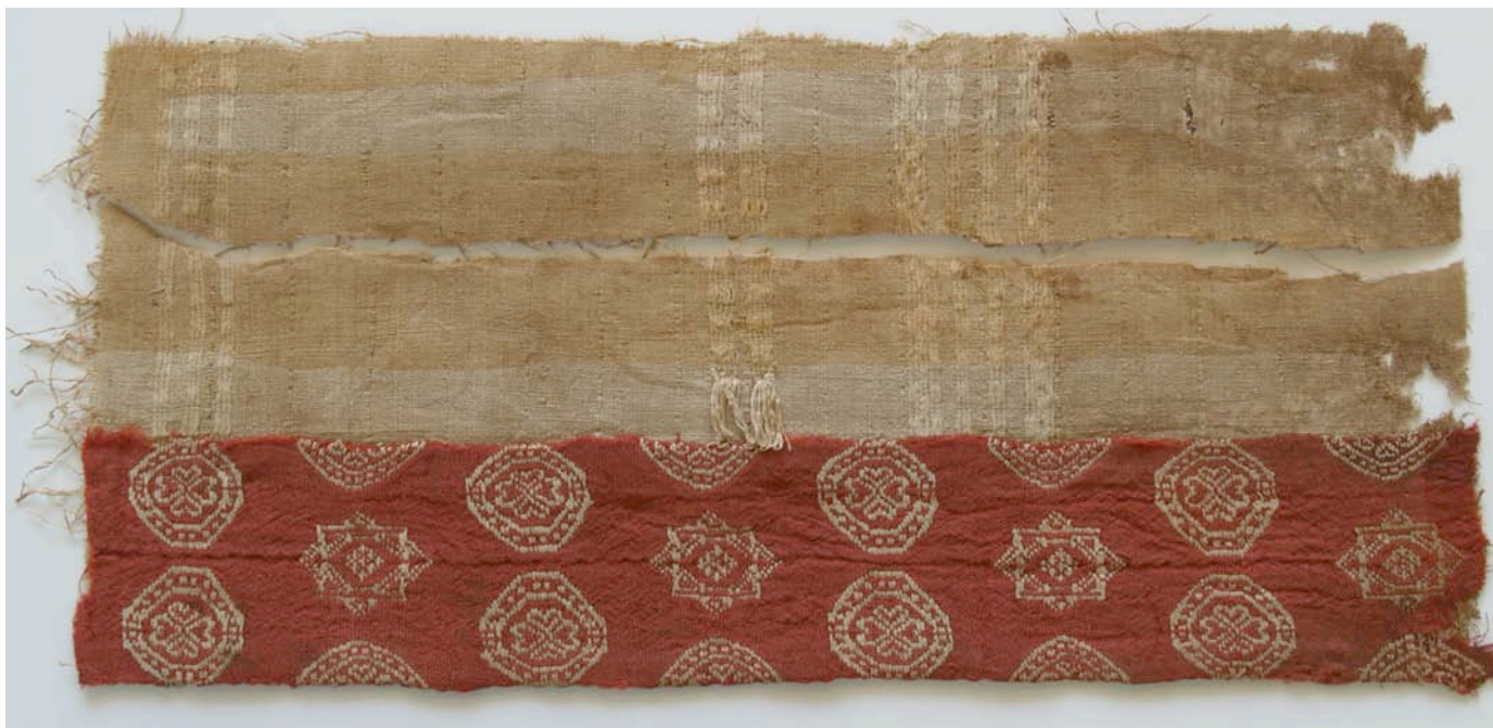
Fig. 4. Banda decorativa cosida a tafetán con reverso de pelos (15073).

Otro elemento interesante es el hecho de que varios tejidos estaban a su vez cosidos a otros que servían de base (fig. 4), como también se observa en otras colecciones, por ejemplo en una túnica del Museu del Disseny de Barcelona (Cabrera, op. cit. : 403-408). El uso de tejidos sin decoración de la misma época a los que se aplicaban otros decorados era bastante común y muestra el interés por las partes decoradas, de modo que cuando una pieza textil estaba deteriorada, se reciclaban las partes decoradas aplicándolas a telas nuevas o en mejor estado (un fragmento del Museo Nacional de Artes Decorativas (13945) está formado por dos tejidos ornamentados diferentes cosidos entre sí: Rodríguez, 2001: 505-508, y 2002: 27-28).