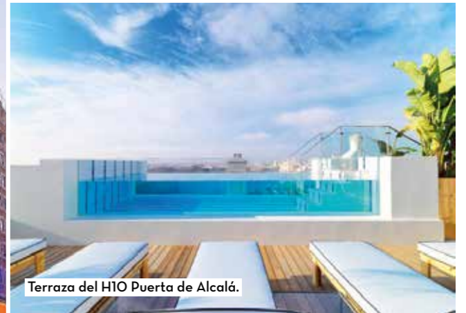
Terraza del H10 Puerta de Alcalá.