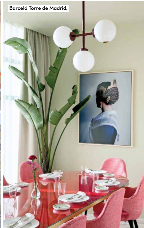
Barceló Torre de Madrid.