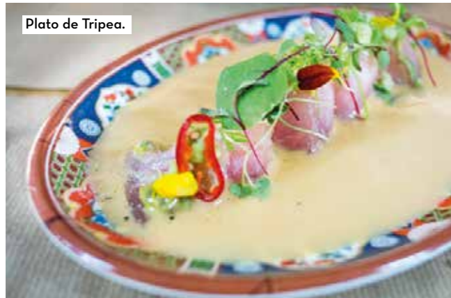
Plato de Tripea.