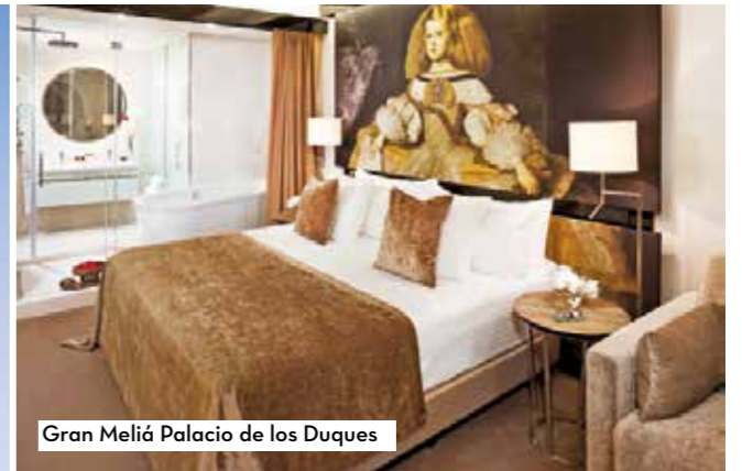
Gran Meliá Palacio de los Duques