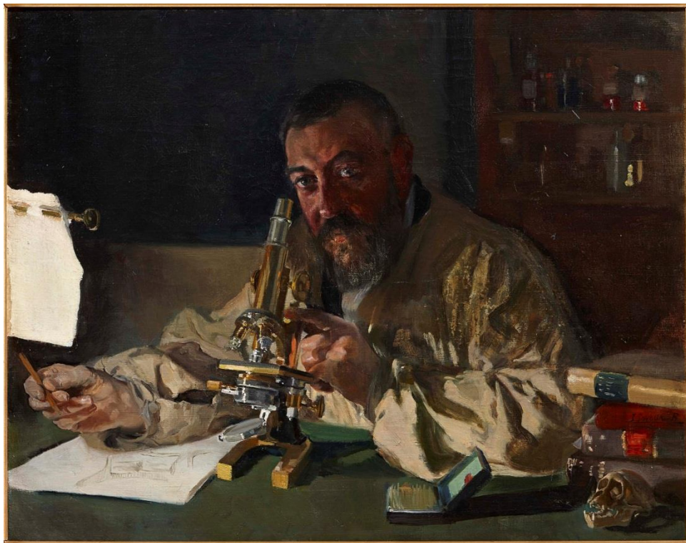
Joaquín Sorolla, El Doctor Simarro en el laboratorio