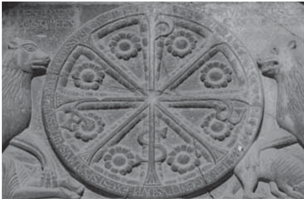
Fig. 2. Catedral de Jaca, tímpano de la portada occidental, crismón.

El desciframiento de la iconografía de la portada jaquesa viene determinado por la interpretación de sus inscripciones. La que circunda el crismón (fig. 2) aporta la clave para trascender y ampliar el significado primigenio del monograma a una dimensión trinitaria: + HAC IN SCVLPTURA LECTOR SIC NOSCERE CVRA / P . PATER . A . GENITVS . DVPLEX EST SP(iritu)S ALMVS / HII TRES IVRE QVIDEM doMINVS SVNT VNVS ET IDEM 4 . Más allá de las diferentes lecturas y de la polémica que ha suscitado la interpretación de los versos 5 , nos interesa