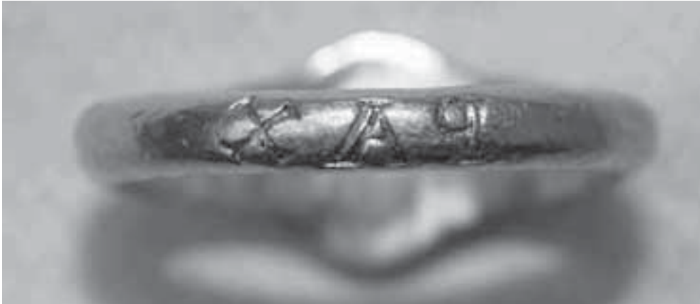
Fig. 5. Anillo procedente de la necrópolis real de San Juan de la Peña. Museo de Huesca, nº inv. 2280.

La cuestión trinitaria caló profundamente en el ideario artístico de los artífices del programa catedralicio. Tal y como ha puesto de manifiesto J.F. Esteban, el proyecto arquitectónico del templo parece marcado por la referencia a la Trinidad. Esto se concreta tanto en las proporciones geométricas y ritmos empleados, articulados a partir del triángulo equilátero y las secuencias ternarias, como en el propio módulo utilizado por los constructores, el diámetro del fuste de la columna, cuya medida se reitera en el crismón del umbral 68 . Así pues, la fe en la Trinidad se revela como fundamento y canon del templo.