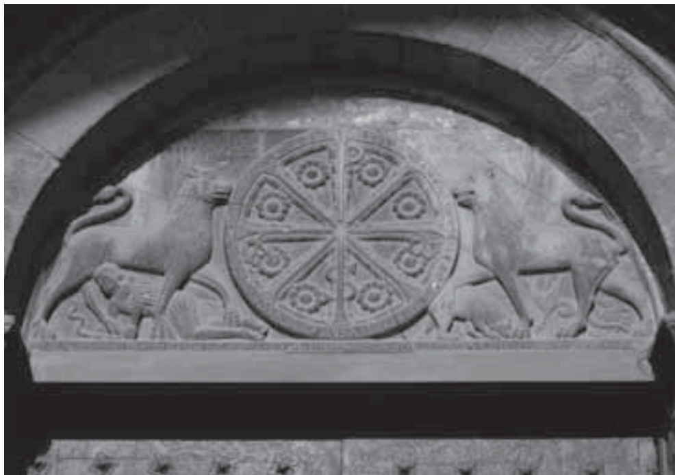
Fig. 1. Catedral de Jaca, tímpano de la portada occidental.

calidad de las mismas, el prestigio de sus autores y su repercusión internacional. Tal volumen de aportaciones ha contribuido a un conocimiento en profundidad de la obra que sugiere continuas revisiones y fomenta nuevas vías de estudio.