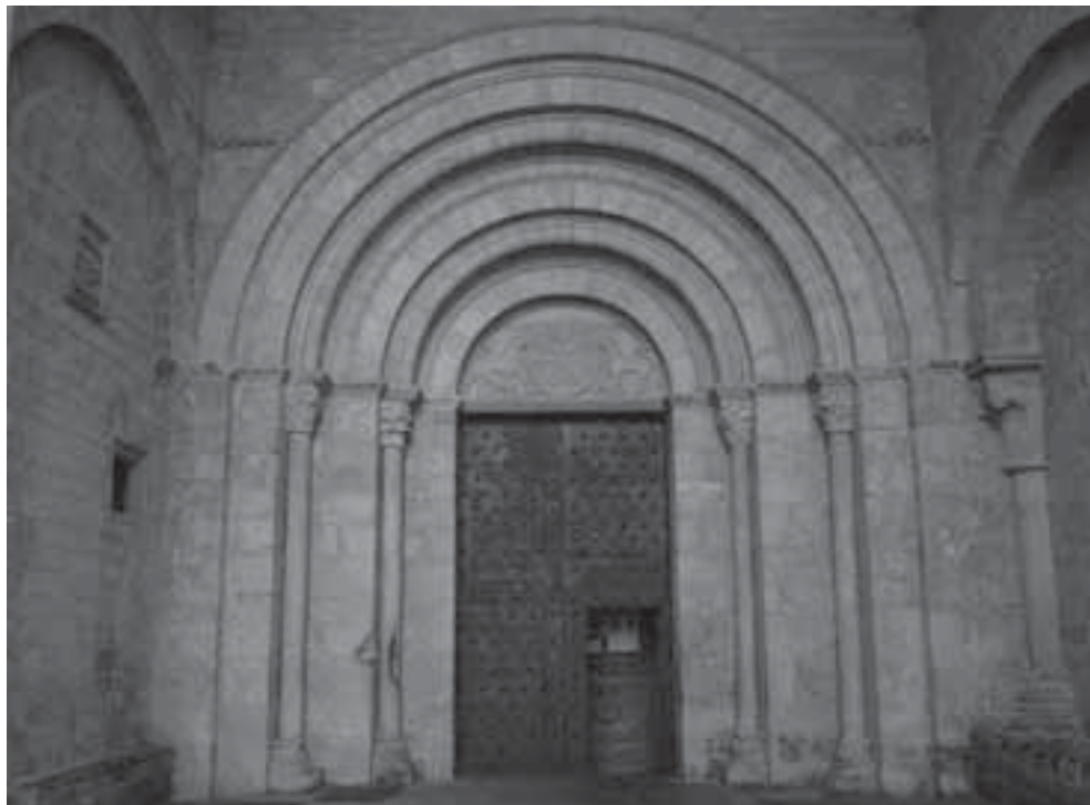
Fig. 3. Catedral de Jaca, portada occidental.

resonancias constantinianas fue emplazado en el tímpano catedralicio jaqués 38 . El antiguo símbolo, renovado ahora por su dimensión trinitaria, conmemoraba mejor que cualquier otro emblema el restablecimiento del vínculo papal granjeado por la vuelta a la ortodoxia. La consustancialidad de las personas divinas enfatizada por el mensaje del tímpano constituía el principio dogmático fundamental cuestionado por las herejías que jalonaban el supuesto pasado herético hispano. De este modo, el renacer de la unidad romana y cristiana, tras una fractura histórica dominada por el cisma, la herejía y las invasiones 39 , se concretaba en términos plásticos 40 en un espacio propagandístico por excelencia como el de la portada de la catedral (fig. 3).